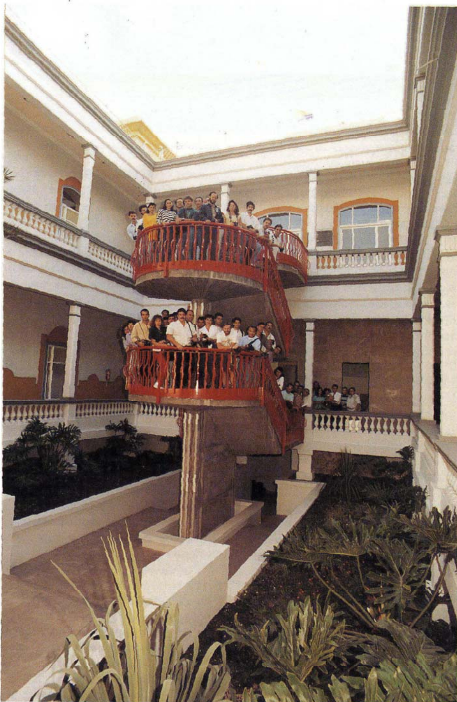
Participantes en las Jornadas Fotográficas «Un día en Las Palmas de Gran Canaria». 27 - 6 - 92

Los talleres de música, literatura y debates, cine, vídeo, fotografía, teatro, danza y escenografía se desarrollan en este edificio