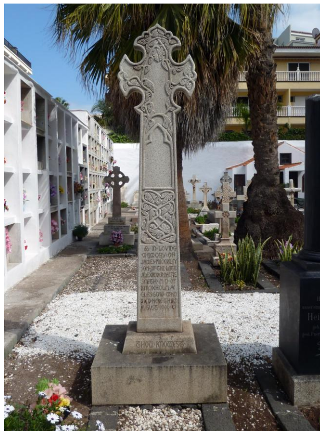
FIGURA 2. Cruz céltica del monumento funerario de James Mackinlay, de Ibroxholm, Glasgow (1906).