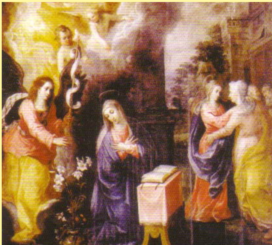
Anunciación y Visitación Óleo sobre tabla Hendrick Van Balen, siglo XVI S.I. Catedral de San Cristóbal de la Laguna La Laguna. Tenerife

Los momentos más importantes de la Historia de la Salvación: De la Anunciación a la Resurrección.