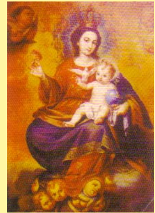
Nuestra Señora de San Salvador Óleo sobre lienzo Anónimo andaluz, siglo XVII Templo Ecuménico El Salvador. San Bartolomé de Tirajana. Gran Canaria.