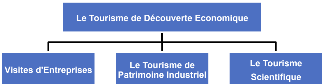
Figura 1: El turismo de descubrimiento económico según la literatura francesa

Más allá de estos ecomuseos, son muchos los términos en francés relacionados con las actividades turísticas ligadas al mundo del trabajo y de la industria. Sin duda, el más extendido es el de “tourisme de découverte économique” (turismo de descubrimiento económico). Según Safarian y Bremond (2001), este término incluye otros tres conceptos más específicos: “tourisme d’entreprises en activité”, “tourisme de patrimoine industriel” y “tourisme scientifique”, como queda recogido en la Figura 1.