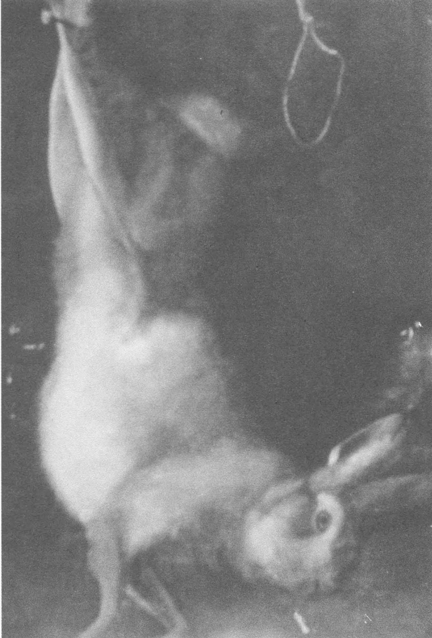
(FIGURA 3). NATURALEZA MUERTA . Correspondiente a la primera época pictórica de Hans Taeger.