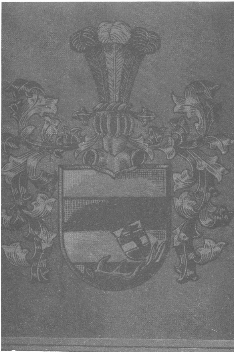
(FIGURA 1). Escudo de la familia TAEGER, pintado por Hans Taeger.