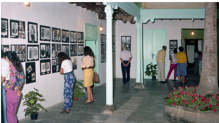
Exposición de Paco Rivero en Guía. Década de 1980.