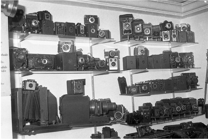
Colección de cámaras fotográficas de Paco Rivero, hoy propiedad de la Fundación Canaria Néstor Álamo.