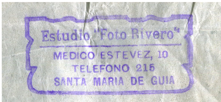
Sello de tinta del estudio de Paco Rivero. Década de 1960.