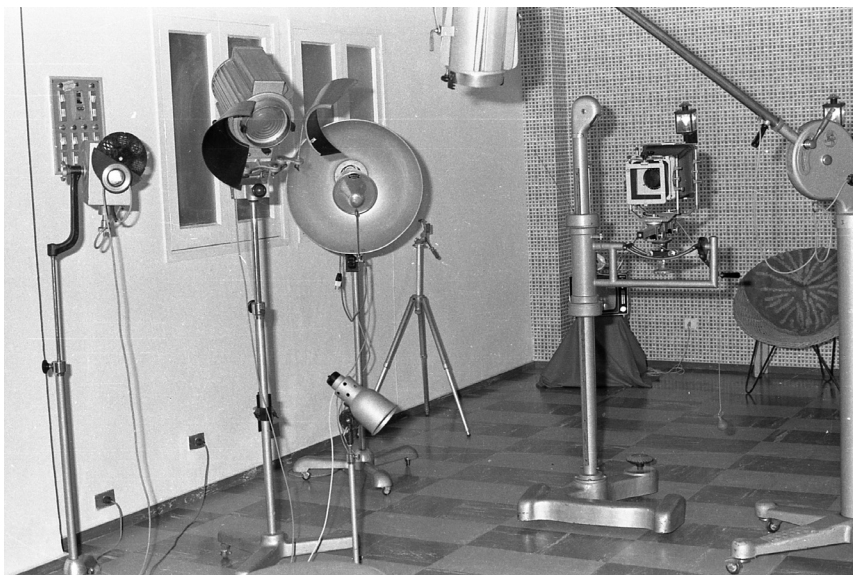
Estudio de Paco Rivero. Década de 1970.