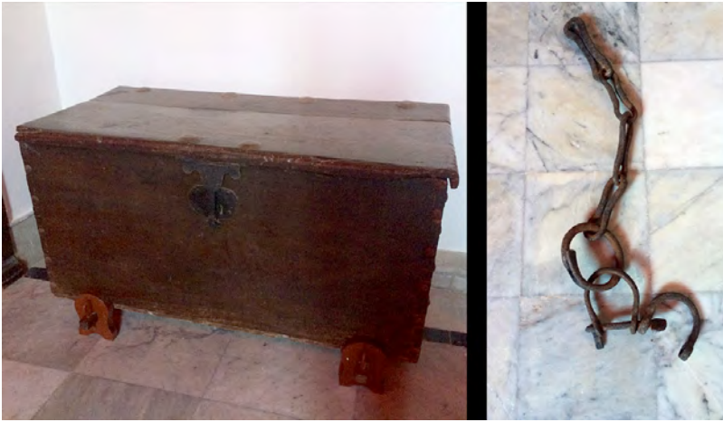
Foto 8. Arcón y grilletes del Moro. Basílica de Nuestra Señora de Candelaria (Candelaria).