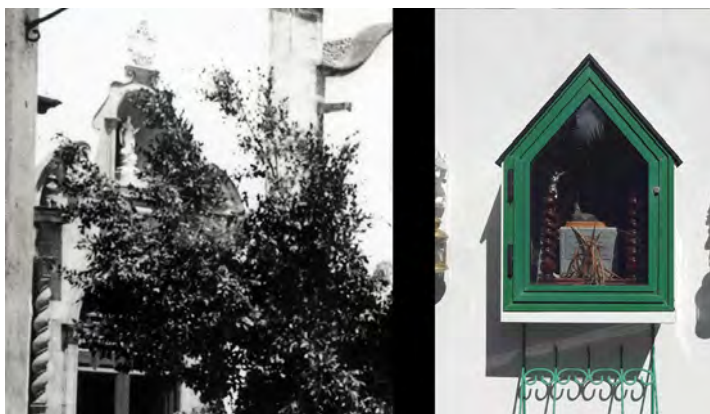
Foto 2. San Pedro de Alcántara . Iglesia de San Francisco de Asís (Santa Cruz de Tenerife) y capilla votiva dedicada a santa Bárbara (Santa Bárbara-Icod de los Vinos).