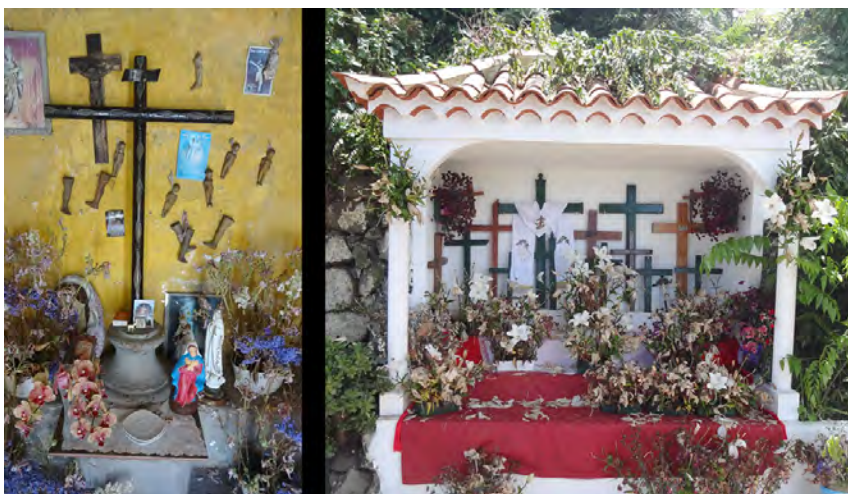
Foto 9. Cruz de Don Lucas (Santa Bárbara-Icod de Los Vinos) y Cruces de La Pared (Icod el Alto-Los Realejos).