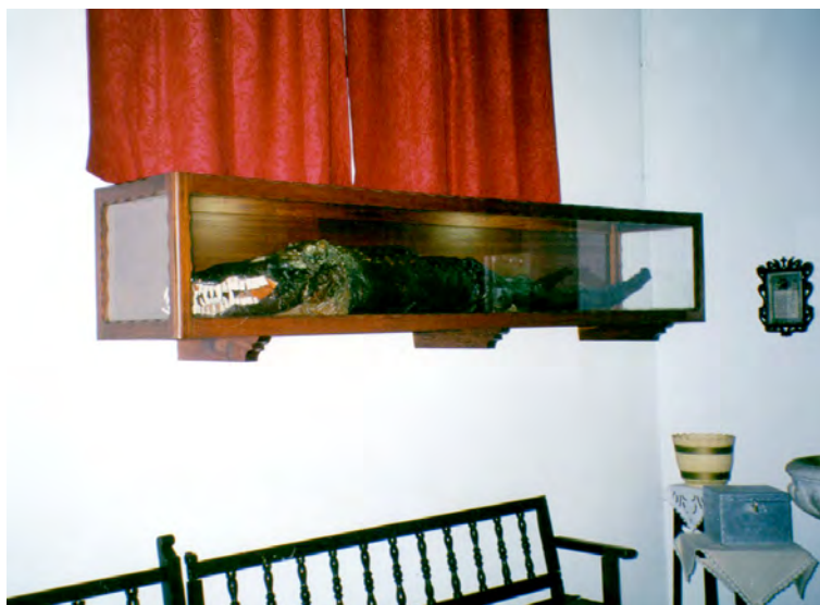
Foto 7. Caimán de Las Angustias . Ermita de Nuestra Señora de Las Angustias (Icod de los Vinos).

Aunque el «Caimán de Las Angustias» es el único en su género que actualmente se puede localizar en el archipiélago canario, parece ser que la presencia de estos especímenes no fue nada extraña en otros templos insulares, como queda constatado en Los Realejos (Tenerife) 53 o en Telde (Gran Canaria) 54 .