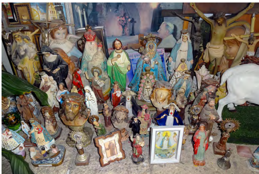
Foto 11. Escultura devocional popular de factura industrial en el Espacio Religioso Cueva del Santo Hermano Pedro de Bethencourt (Granadilla de Abona).