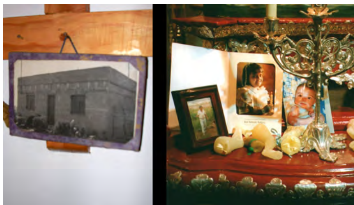
Foto 6. Fotografías votivas en las ermitas de Ntra. Sra. del Socorro (Tegueste) y San Roque (San Cristóbal de La Laguna).

mordiales y referenciales a representar bajo esta expresión gráfica (ya fuere solos o acompañando al devoto). Así, se puede encontrar al efigiado junto a la herramienta o vehículo que le sirve de sustento 43 , los animales de compañía (ermita de San Antonio Abad, La Matanza de Acentejo), el ganado (E.R. Cueva del Santo Hermano Pedro de Bethencourt, Granadilla de Abona) o la propia vivienda en construcción (ermita de Nuestra Señora del Socorro, Tegueste). [Foto 6]