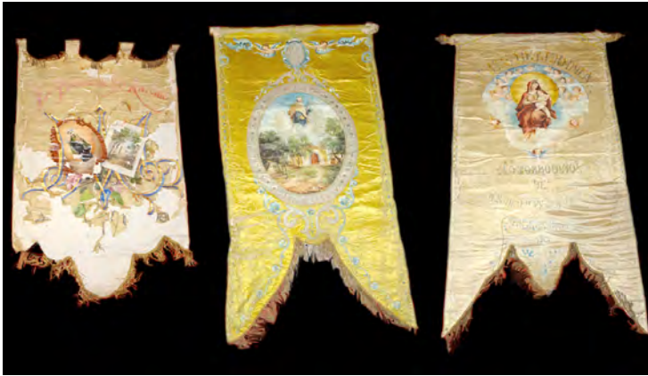
Foto 5. Pendones procesionales ofrecidos a la Virgen del Carmen. Iglesia de Nuestra Señora del Carmen (Los Realejos).

manifiesta una gloria con la Virgen y el Niño desnudo sentado sobre su pierna izquierda, al tiempo que detrás de esta Sagrada Maternidad se vislumbra una aureola fulgurante entre nubes aborregadas y acompañada por una cohorte de angelotes. Corona la decoración de esta pieza una dedicatoria epigráfica pintada (A.N.S. DEL CARMEN / PUERTO DE LA CRUZ / 1904), completada con otra bordada y enriquecida con lentejuelas y mostacilla (LA PARROQUIA DE N S DE LA PEÑA DE FRANCIA). Concretamente, esta obra se enmarca dentro de la segunda etapa formativa de la artista 35 . [Foto 5]