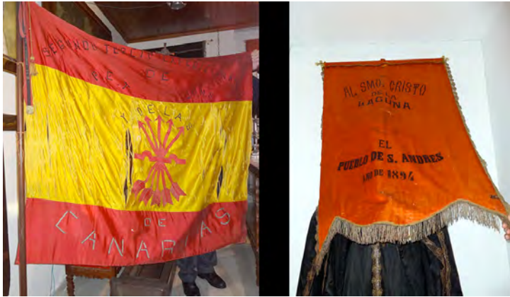
Foto 4. Bandera y pendón procesional localizados en el Tesoro de la Pontificia, Real y Venerable Esclavitud del Santísimo Cristo de La Laguna (San Cristóbal de La Laguna).

trono le fueron ofrecidos por sus respectivos representantes y que recibió el Illmo. Prelado [Ramón Torrijos y Gómez], terminada la procesión». Llama la atención que uno de ellos presentase la siguiente dedicatoria: A LA STMA. VIRGEN DE CANDELARIA. UNA PERSONA DEVOTA. IGUESTE DE SAN ANDRÉS. Ya que el resto de presentes disponen, salvo sutiles matices, una dedicatoria explícita a la antedicha advocación mariana y la identificación correspondiente del colectivo que la entregó 31 .