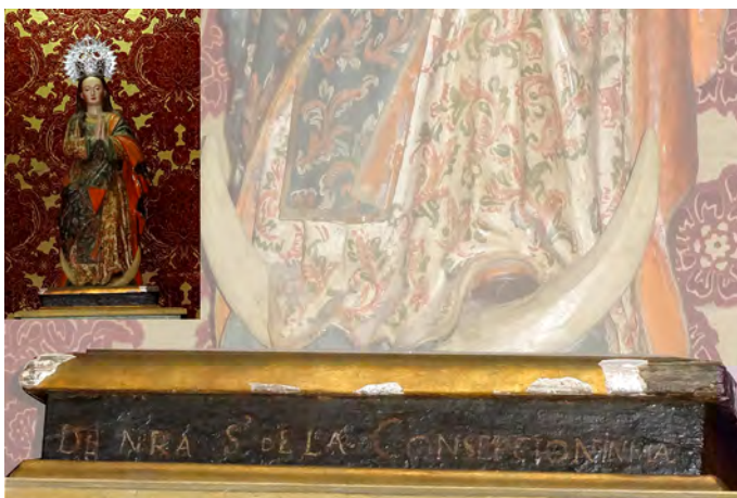
Foto 1. Inmaculada Concepción . Escultura devocional votiva (iglesia de San Antonio Abad. Arona).

tanto su autoría como el lugar de su ejecución y la causa por la que fue ofrendado se desprende de la inscripción dispuesta en su peana 8 . [Foto 1]