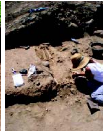
A la izquierda, bajo la imagen de localización del yacimiento, fotografías de algunos de los restos prehistóricos encontrados (loza y conchas de lapas y burgados). A la derecha, restos del ingenio azucarero y proceso de limpieza de una de las tumbas.

Puesto que los trabajos arqueológicos se han centrado de manera prioritaria en los vestigios prehistóricos, su documentación está más avanzada y ha aportado importantes novedades para la prehistoria insular. Se ha recuperado un volumen extraordinario de materiales de muy buena calidad, consistentes en fragmentos de loza de muy variadas formas y tamaños, numerosas herramientas de piedra realizadas en basalto y obsidiana, objetos de huesos como espátulas y punzones, además de muchos restos de fauna terrestre de cabras ovejadas y cerdos, y marina, sobre todo de lapas y burgados.