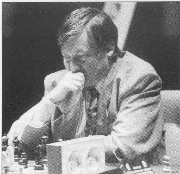
Anatoly Karpov, campeón del mundo

próximo año un Match cuadrangular en el que intenta contar con: Karpov, Kasparov, Anand y Morovic.