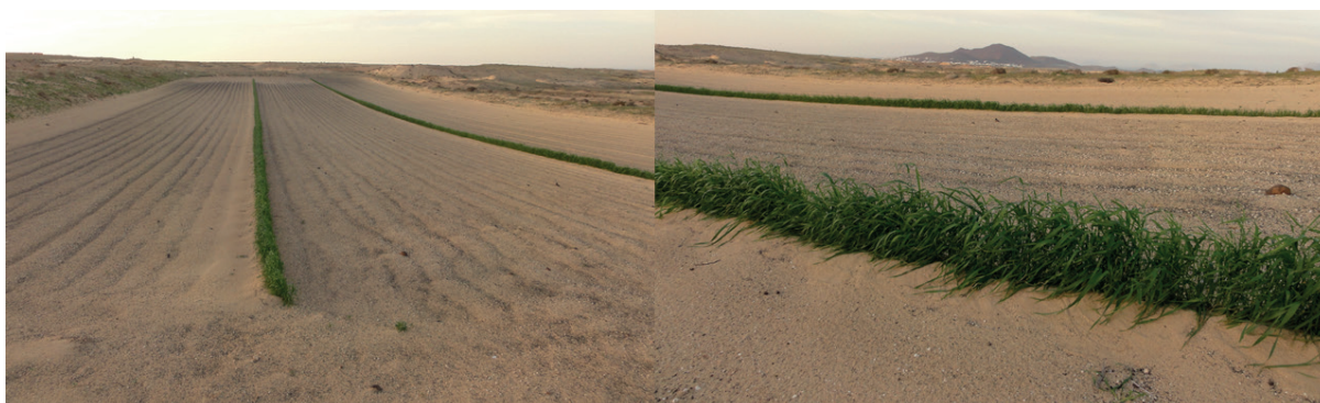
Figura 2. Métodos para evitar las afecciones de la arena sobre los cultivos en El Jable.

Así mismo, un proceso menos estudiado es la posible removilización de la arena por la carga ganadera que han soportado los sistemas eólicos del archipiélago a lo largo de la historia. Con el objetivo de proteger los cultivos de estos problemas, en Lanzarote se desarrolló un sistema agrícola basado en la instalación de fardos perpendiculares a la dirección del viento para que la arena se acumulase en ellos y así luego ser redistribuida (Fig. 2).