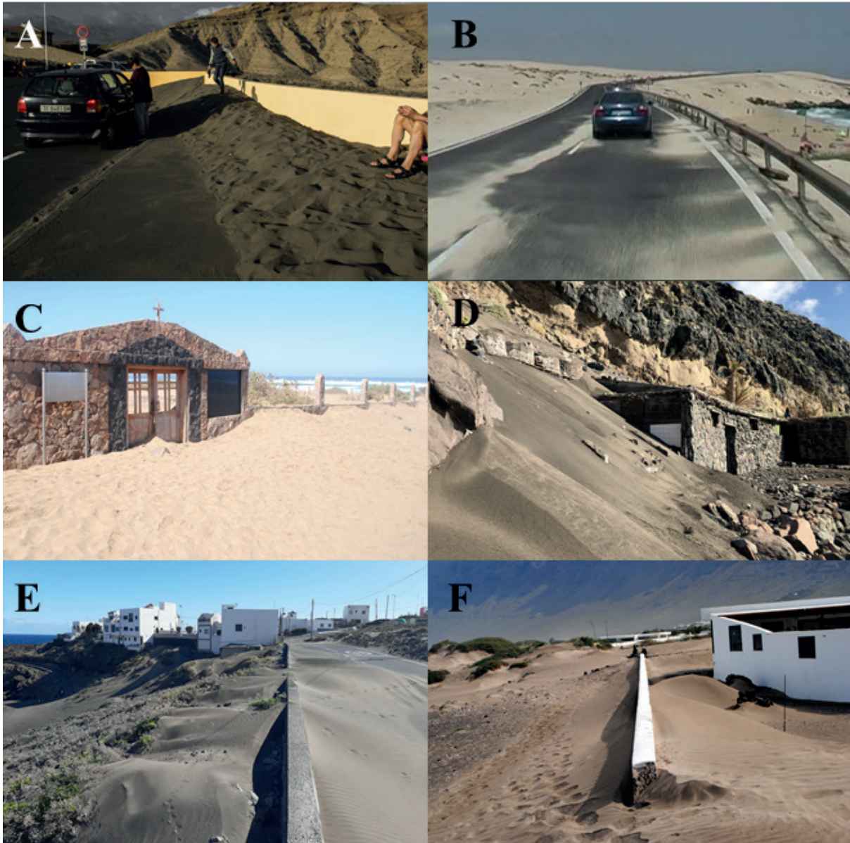
Figura 3. Afecciones actuales producidas por la instalación de infraestructuras en los sistemas playa-duna de: A) El Médano, B) Corralejo (Fuerteventura hoy, 20/10/2018), C) cementerio de Cofete, D) Antequera, E) Punta del Porís y F) El Jable.