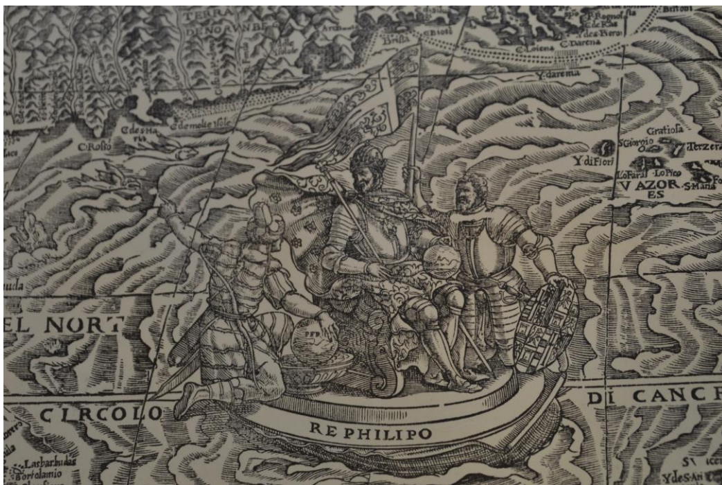
Fig. 6. Giacomo Gastaldi, Cosmographia Universalis et Exactissima iuxta postremam neotericorum traditionem , 1562 (det.).