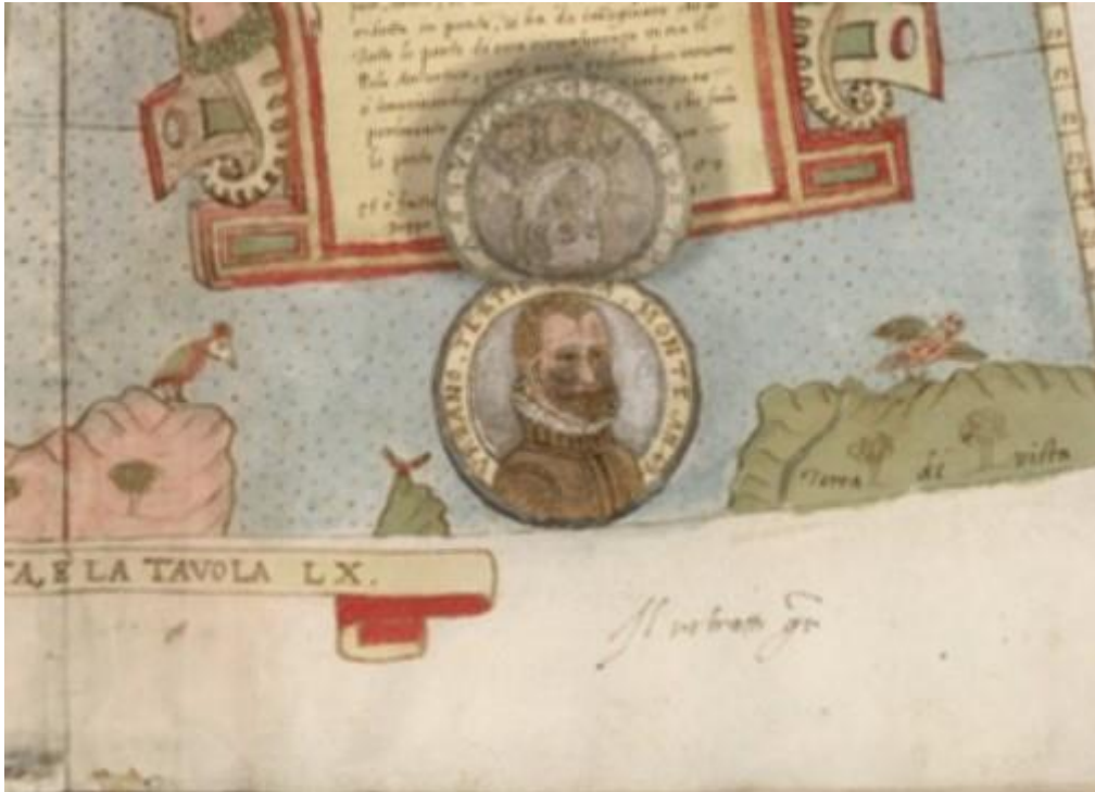
Fig. 1. Tavola XXXXII (det.).

Et è fatto da Urbano Monte, l'an(n)o 1587 dopo la Natività di nostro signore 22 .