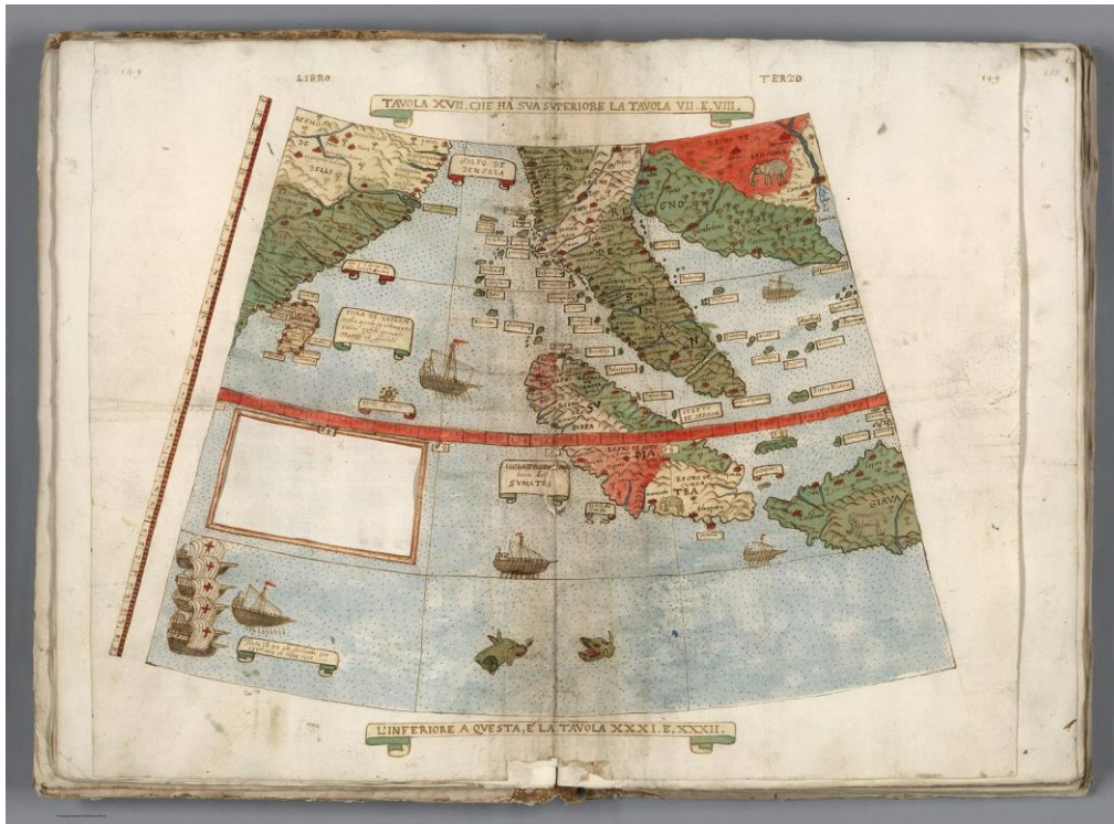
Fig. 4. Tavola XVII.