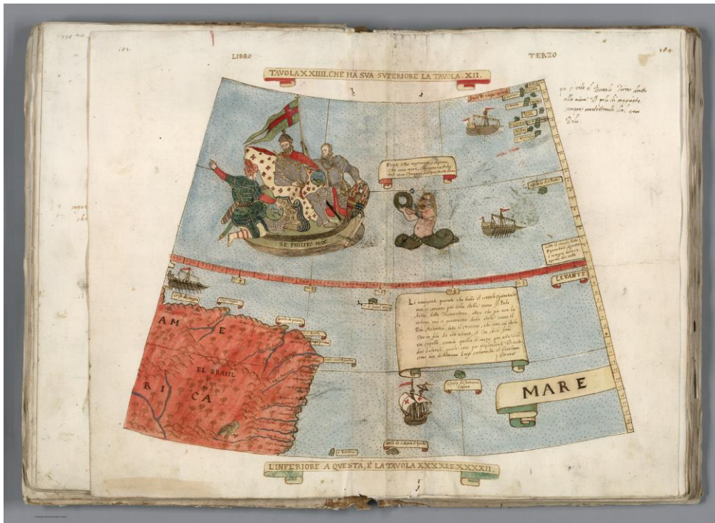
Fig. 5. Tavola XXIV.