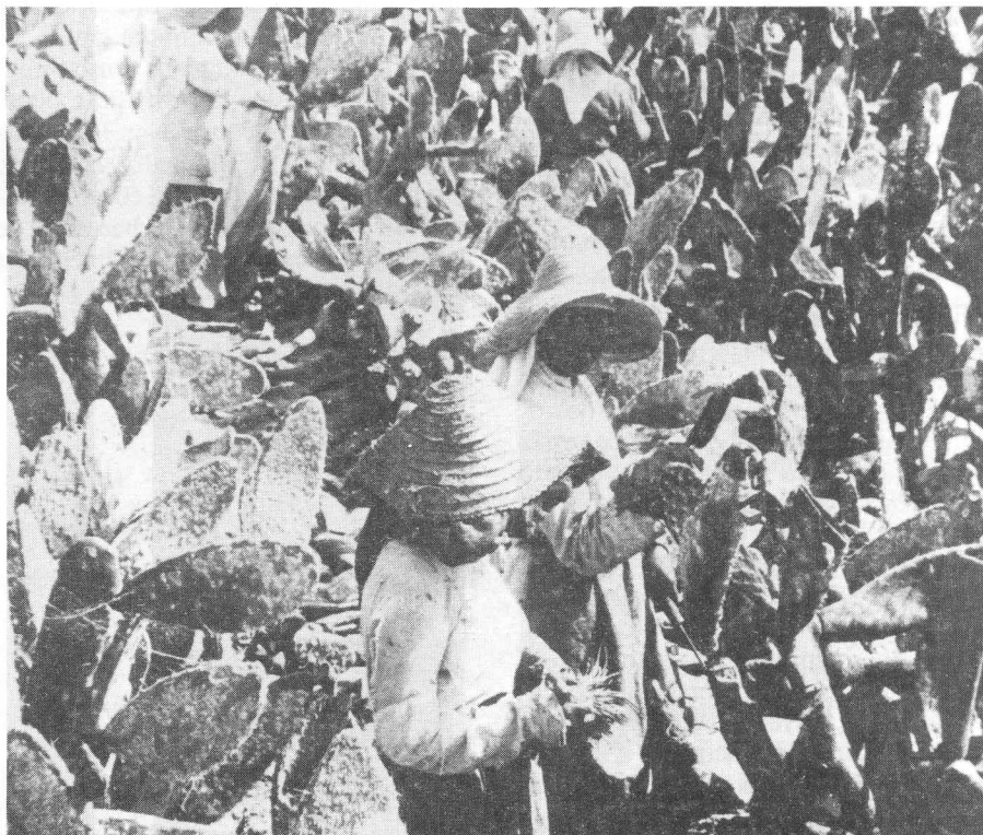
El cultivo y exportación de la “cochinilla” significó una fase singular en la historia económica de la comarca de Arucas.

Con la segunda mitad del siglo XIX se abre una etapa resplandeciente en la vida de nuestra jurisdicción, en donde ya había cristalizado el correspondiente Ayuntamiento constitucional, después de algunas intenciones, que de alguna forma tradujeron a escala local el histórico contencioso librado entre absolutistas y liberales. El triunfo de los partidarios de la Constitución hizo posible la puesta en marcha de leyes desvinculadoras y desamortizadoras de bienes rústicos no enajenables ni vendibles, que supuestamente no estaban en óptima explotación y de ahí la necesidad de ofertarlos a quienes pudiesen rentabilizar mejor dichos predios.