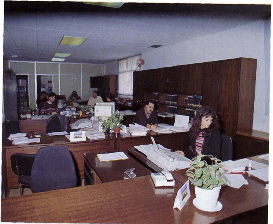
Departamento de personal

neral supervisa todos los informes de tipo jurídico elaborados por las distintas áreas y dirige el aparato administrativo necesario para el desarrollo de ambas funciones. En este sentido, la Secretaría actúa como coordinadora de todas las actuaciones que desempeñan las distintas áreas de la Corporación, ya que todo tiene un contenido jurídico—organizativo.