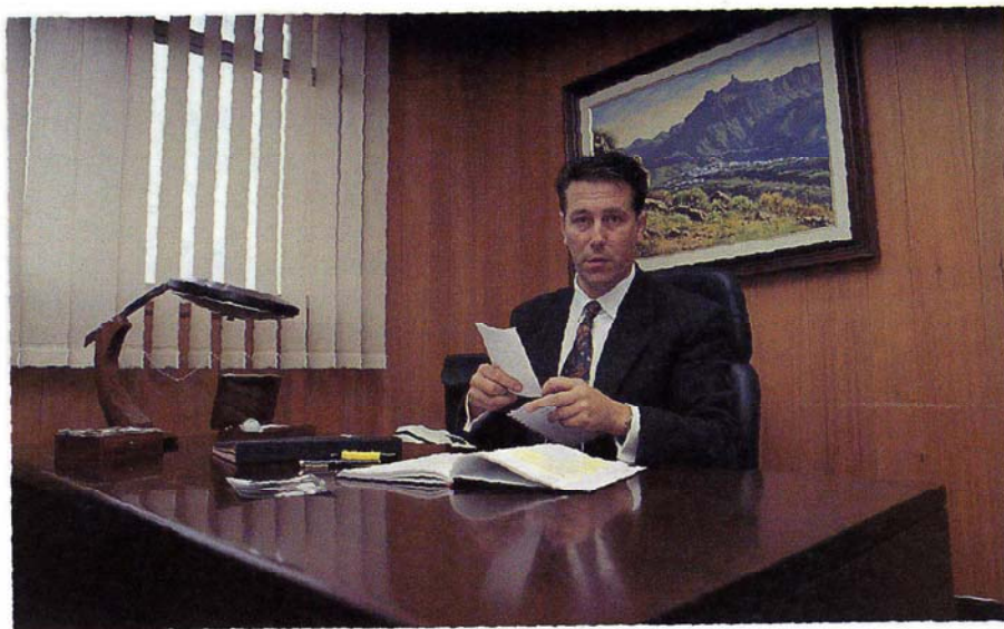
Ezequiel Ramírez, consejero de Régimen Interior y Patrimonio

En cuanto al personal que trabaja en el Cabildo, a pesar de ser un dato que fluctúa mucho, en estos momentos dependen de esta Corporación unos 2.500 trabajadores. De ellos, aproximadamente 473 son personal laboral, 42 funcionarios de empleo, 481 funcionarios, 32 empleados del Patronato de Turismo, 596 del Órgano de Gestión, 99 de la Orquesta Filarmónica, 92 de Sial-