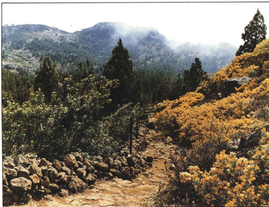
Camino de la Portada - Cruz de Juan Pérez (próximo a Las Mesas)

prende la recuperación de unos 200 kilómetros de senderos. Esta fase incluye lo que se denomina "Circuito de Medianías"; caminos reales que unen a los municipios de Santa Lucía, Valsequillo, San Mateo, Santa Brígida, Teror, Moya, Firgas y Valleseco. También incluye