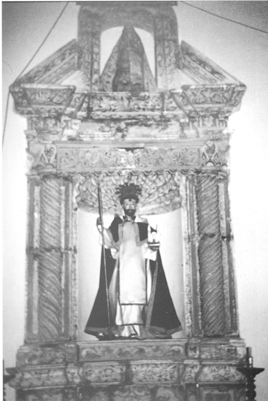
Retablo de Santo Domingo, con las imágenes del titular y de Nuestra Señora de los Ángeles. Iglesia de San Francisco. Telde.