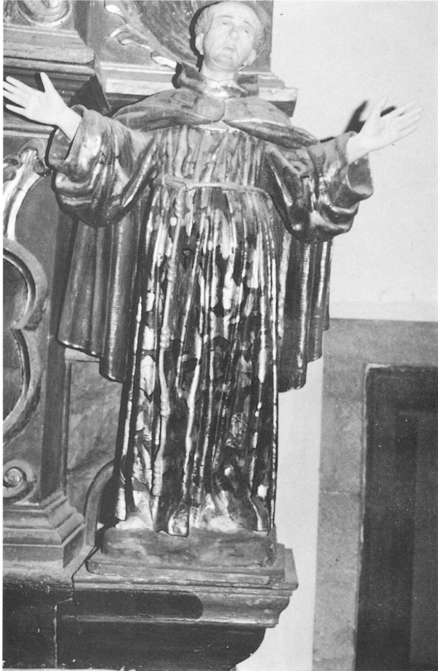
Imagen de San Pedro de Alcántara. Iglesia de San Francisco. Telde.