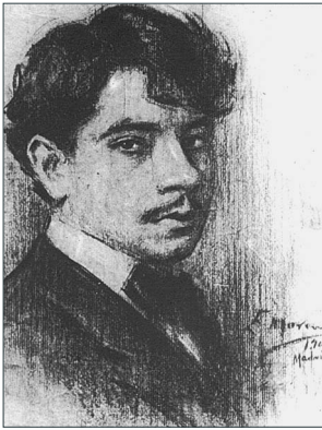
Retrato de Tomás Morales, Madrid, 1905. E. Moreno. Paradero desconocido. Reproducción del archivo fotográfico de la Casa-Museo Tomás Morales. Cabildo de Gran Canaria.

Firma, el joven dibujante; precoz en la madurez en el arte, en la parte superior derecha, con solo la inicial de su nombre y sus dos apellidos completos: en mayúsculas y subrayados, E. MORENO DURÁN . Debajo de la firma, también en mayúsculas, escribe la ciudad y el año de ejecución de la obra, MADRID, 1905 .