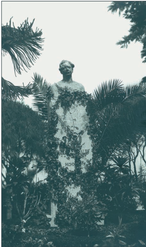
Busto del poeta Tomás Morales situado en el Parque Cervantes [Parque San Telmo], Las Palmas, ca. 1925.

Le comunica además (por la gran preocupación que tenía Morales), que había hecho unas pesquisas en los sótanos de la editorial Casa Fluiters , con el objeto de encontrar los fotgrabados de la impresión del libro. Feliz fue el