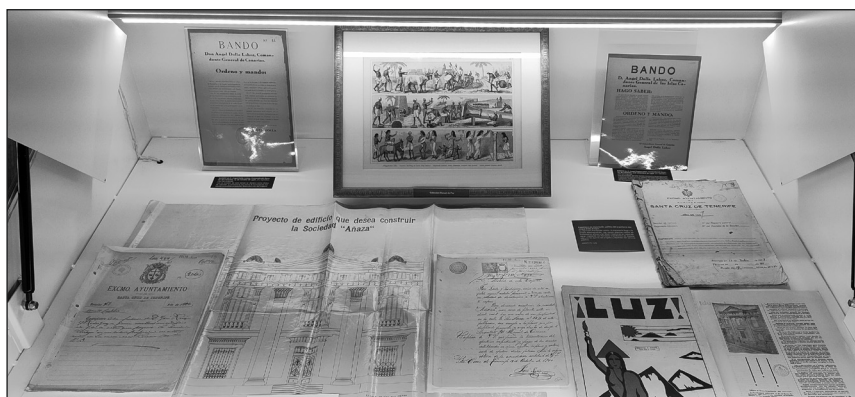
Vitrina 4: La represión de la masonería.