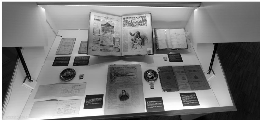
Vitrina 2: Masones ilustres y la mujer en la masonería.