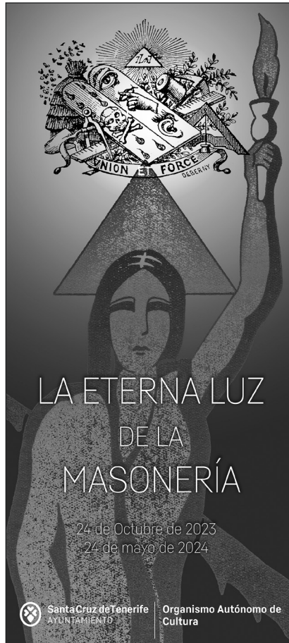
Diseño del cartel para la muestra.