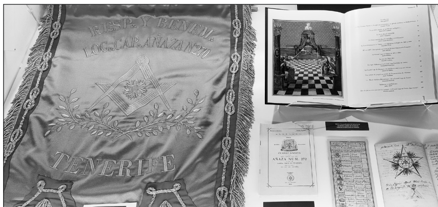
Vitrina 3: La Logia de Añaza.