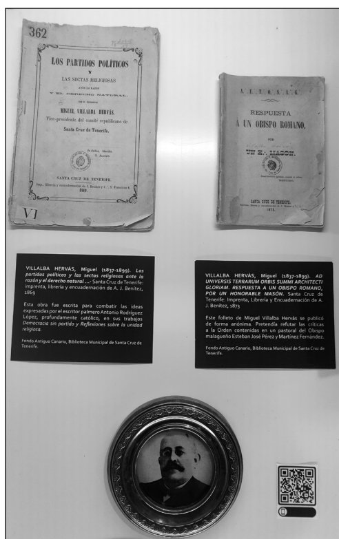
Vitrina 2: Los partidos políticos y las sectas religiosas (Signatura: F1 209-5/19) and Respuesta a un Obispo Romano (Signatura: F1 210-1/ 8) obras de Miguel Villalba Hervás.