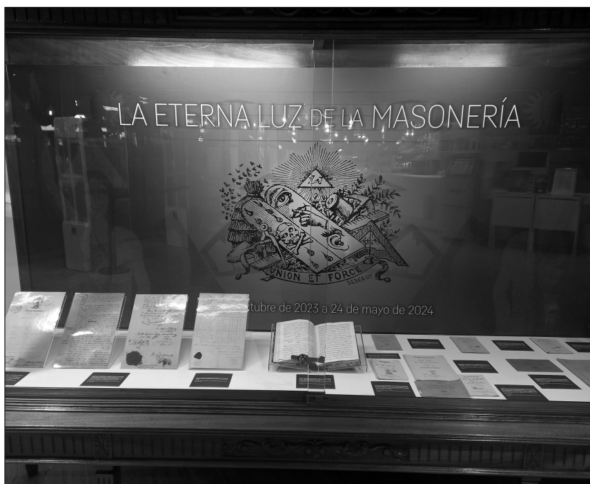
Vitrina 1: Los orígenes de la masonería en Canarias.