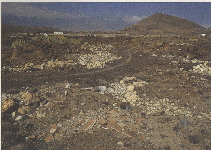
La primera actuación en la Reserva fue la limpieza del sector costero. Al fondo se puede apreciar Montaña Grande dominando el espacio.

han impartido cursos, charlas y conferencias, se han montado exposiciones, participado en programas de radio y televisión, se han sacado notas y artículos en la