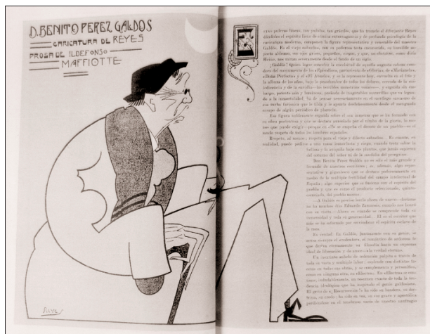
Don Benito Pérez Galdós. Castalia , Santa Cruz de Tenerife, núm. 4, 29 de enero de 1917.