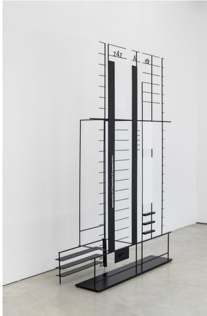
Sugar in the ashes, Official Capacity 2017, Acero con recubrimiento en polvo Escultura 230 x 150 x 52cm © Marlena Kudlicka