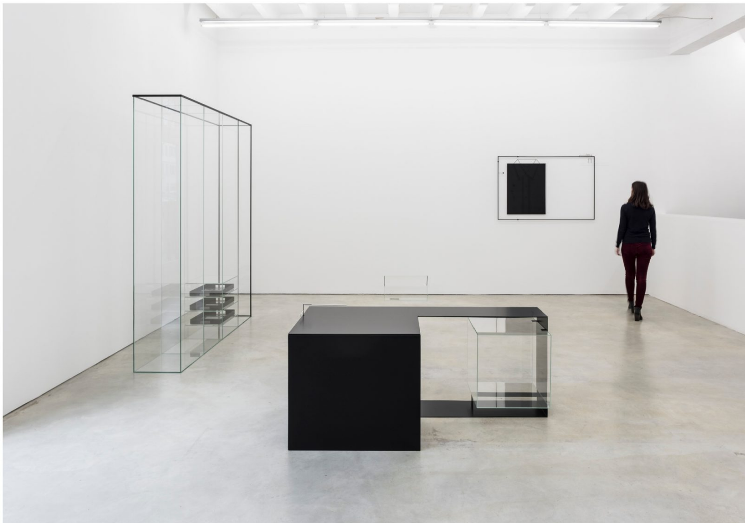
Marlena Kudlicka Elements of Peaceful Engagement. phrase insert , 2017 © Marlena Kudlicka, cortesia ŽAK | BRANICKA