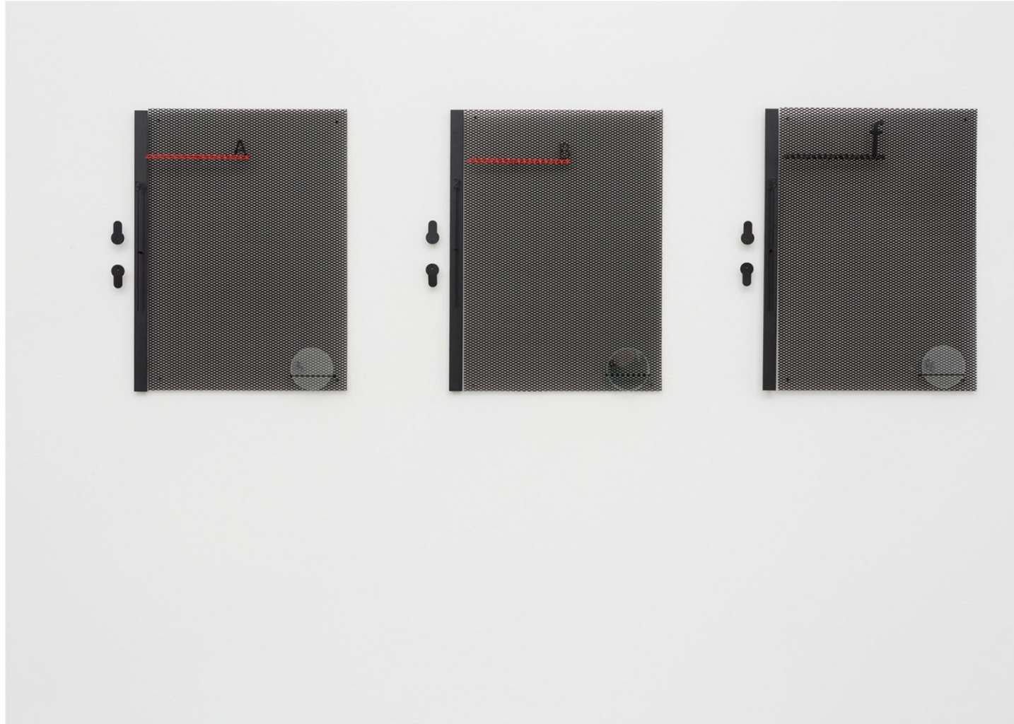
Sugar in the Ashes, Official Capacity oA oB oF, 2017, collage escultórico series de 3 42 x 35 x 4cm cada collage 3 collages 42 x 130 x 4cm Acero con recubrimiento en polvo, cristal © Marlena Kudlicka