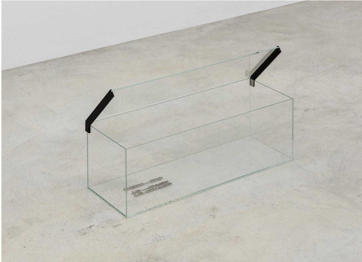
Marlena Kudlicka Elements of Peaceful Engagement. phrase container , 2017, Acero con recubrimiento en polvo, cristal, 34 x 63 x 22 cm © Marlena Kudlicka, cortesía ZAK | BRANICKA