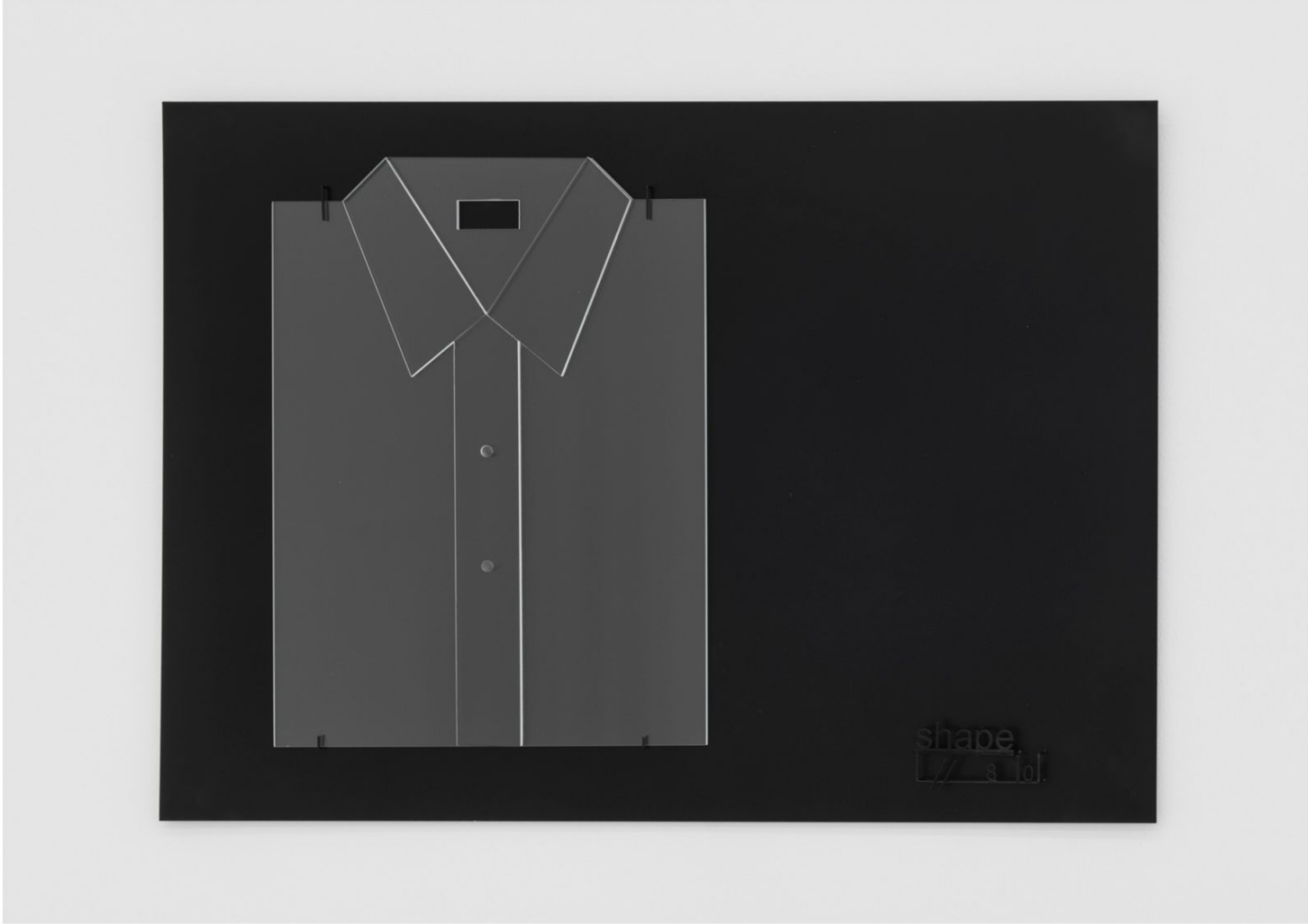
Marlena Kudlicka Elements of Peaceful Engagement. phrase insert, 2017 Acero con recubrimiento en polvo, cristal, 240 x 216 x 40 cm