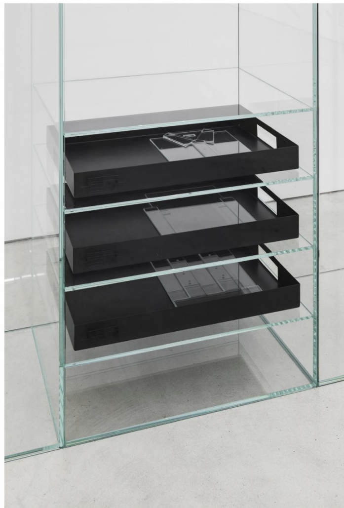
Marlena Kudlicka Elements of Peaceful Engagement. phrase insert , 2017 Acero con recubrimiento en polvo, cristal, 240 x 216 x 40 cm