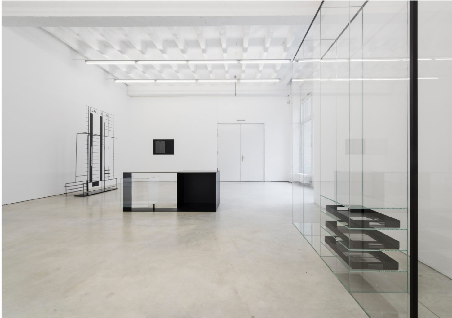
Marlena Kudlicka Elements of Peaceful Engagement , 2017, © Marlena Kudlicka, cortesia ŽAK | BRANICKA