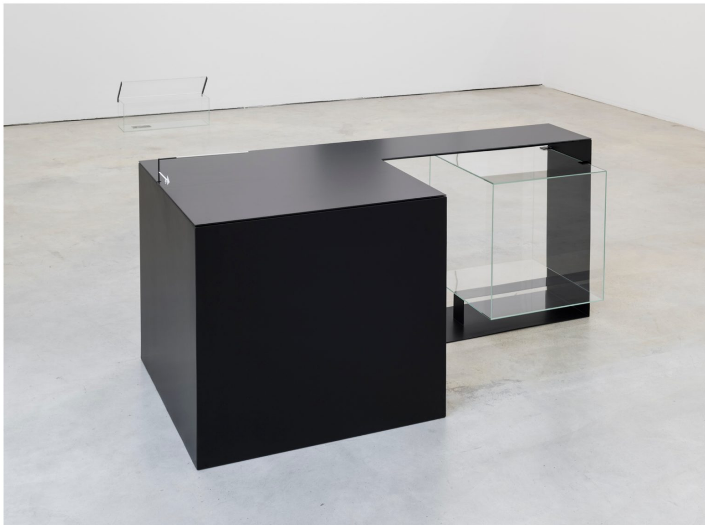
Marlena Kudlicka Elements of Peaceful Engagement. phrase station/desk. 2017 Acero con recubrimiento en polvo, cristal, 78 x 170 x 90 cm © Marlena Kudlicka, cortesía ZAK | BRANICKA