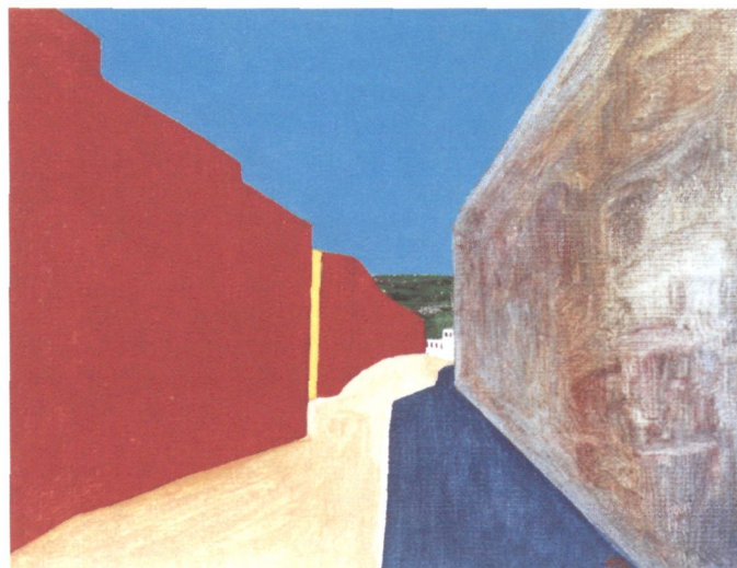
CRISTÓBAL GUERRA. Sin Título , 2000. 19 x 23,5 cm, óleo sobre lienzo | Oil on canvas.

Torrens mostrará, en San Antonio Abad, parte del Project Room que llevó a ARCO 2001 titulado Autopistas . Se trata de