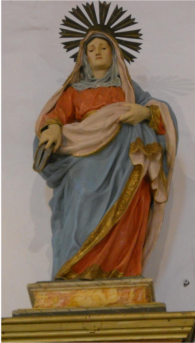
Figura 3. Santa Ana. Parroquia de San Mateo, Gran Canaria.