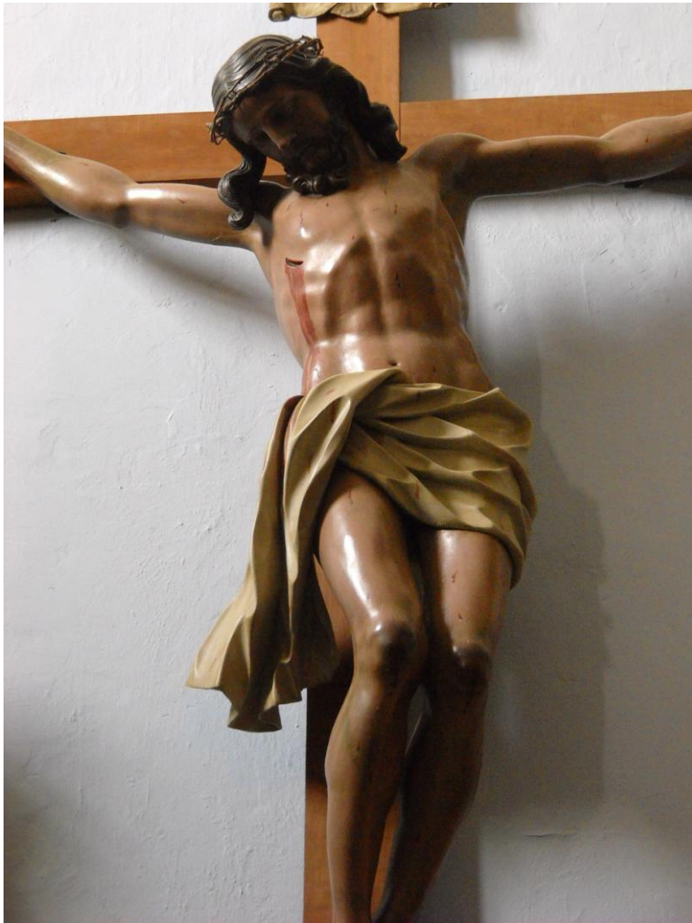
Figura 4. Cristo crucificado. Parroquia de Valsequillo, Gran Canaria.

titular que fue reformado en 1802) y la nueva talla de San Miguel, otro trabajo de Luján sobre el que volveré luego por sus repercusiones devocionales 56 . Asimismo es probable que sea obra suya un pequeño crucificado que se conserva en la casa parroquial y estuvo vinculado con los altares laterales, quizá uno de “los dos santos cristos” que se compraron a principios del siglo XIX por 12 pesos 57 [fig. 5].