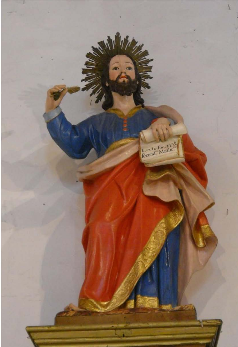
Figura 2. San Mateo. Parroquia de San Mateo, Gran Canaria.

tejidos y “del cuadro del altar mayor con el sitial”, piezas que se antojan imprescindibles para conocer la primitiva estructuración de su cabecera o la sencillez del mobiliario que lo presidía 19 .