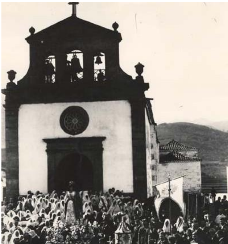
Figura 1. Parroquia de la Vega de San Mateo (antigua estructura), Gran Canaria.

Rodríguez había procurado la adquisición de un retablo para el presbiterio antes de 1800 14 .