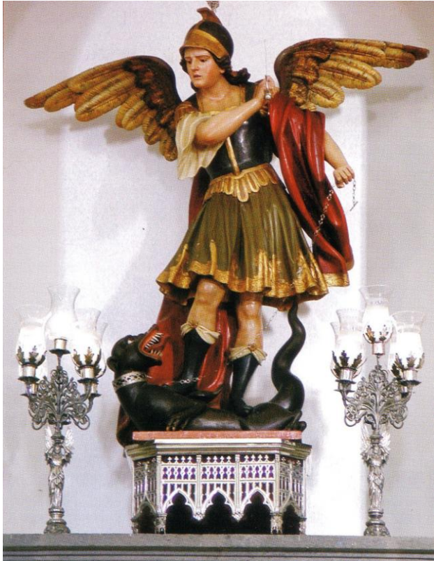
Figura 7. San Miguel. Parroquia de Valsequillo, Gran Canaria.