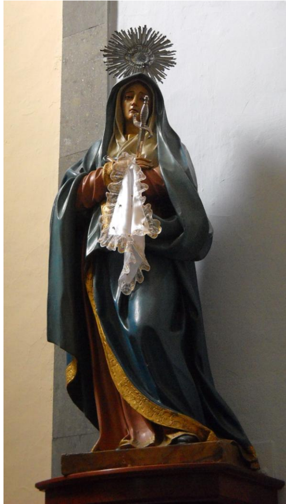
Figura 6. Virgen de los Dolores. Parroquia de Valsequillo, Gran Canaria.