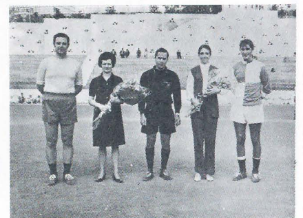
Los capitanes con sus madrinas y el árbitro.

En resumidas cuentas, a los Solteros les faltó para ganar marcar un gol más y a los Casados les sobro "estómago", caídas de narices y de... lo otro.