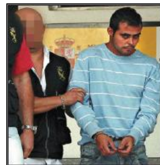
Fig. 7: El Periódico

Diego, víctima (Figs. 8–21). La cobertura gráfica del ‘caso Aitana’ da un vuelco. En primer lugar, las mismas fotografías de agencia extravían personajes (los agentes