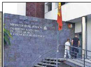
Fig. 15: Qué!