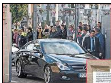
Fig. 21: Qué!