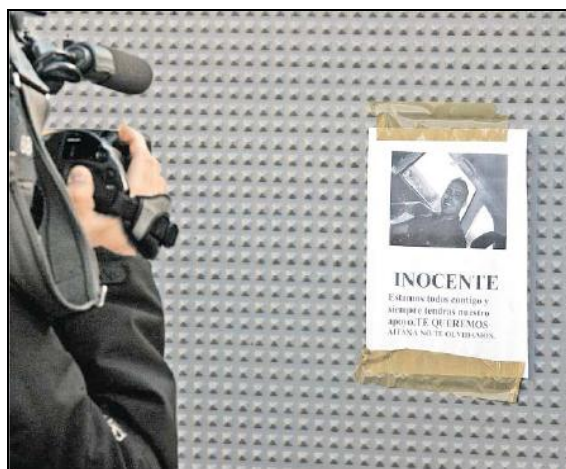
Fig. 12: Abc