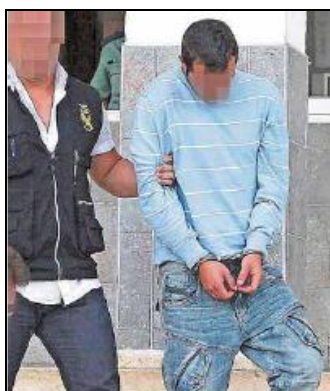
Fig. 16: Qué! Abc