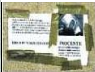
Fig. 14: El Periódico Qué!