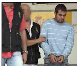
Fig. 2: El Mundo El Periódico