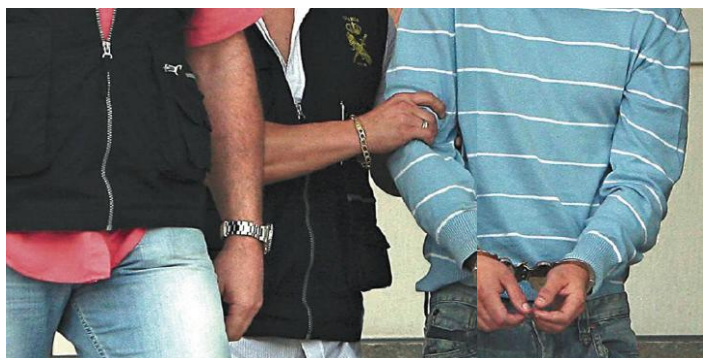
Fig. 17: El País