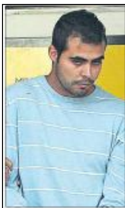
Fig. 9: 20 minutos