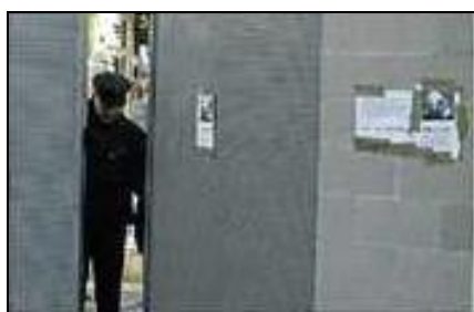
Fig. 13: El Periódico