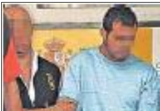
Fig. 11: Qué!