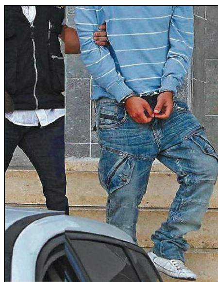
Fig. 10: El País