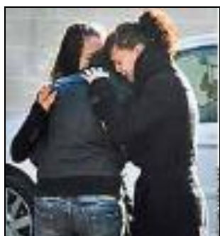
Fig. 18: Qué!