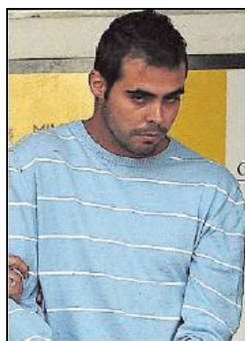
Fig. 5: Abc