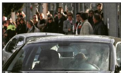
Fig. 20: El Mundo