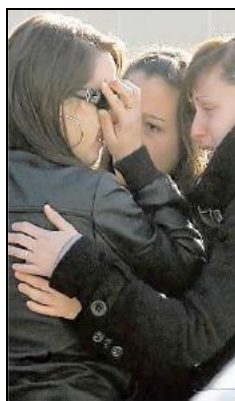
Fig. 19: Abc