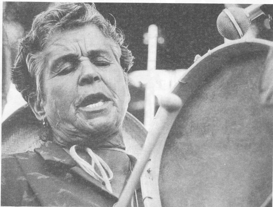
Premio Tema Canario. Autor: Nacho González Oramas.