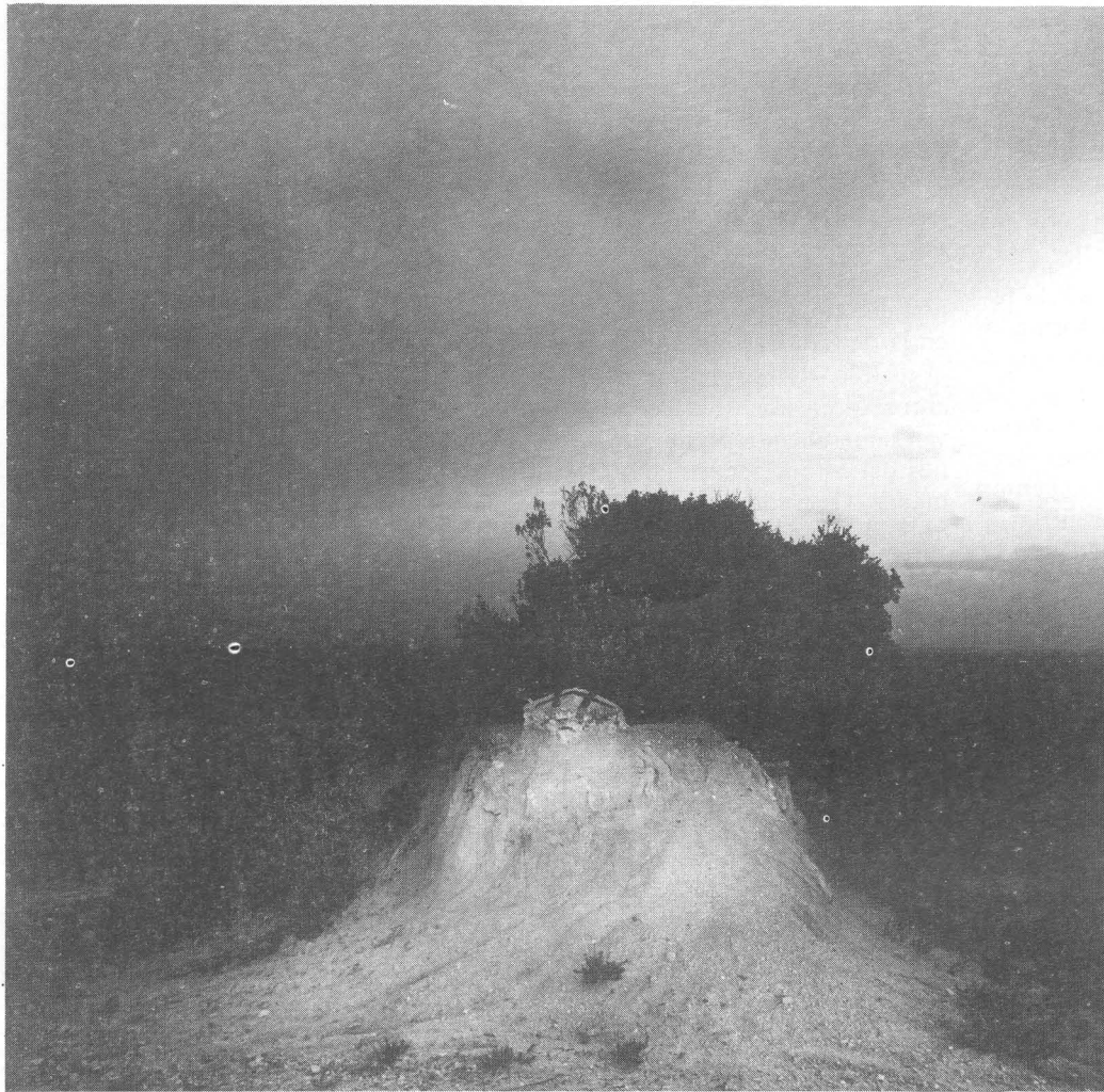
Premio individual blanco y negro. Autor: Fernando Flores Huecas.