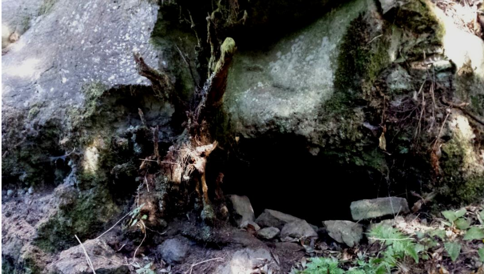
Imagen 4. Boca de la cueva funeraria con círculos concéntricos a su derecha.