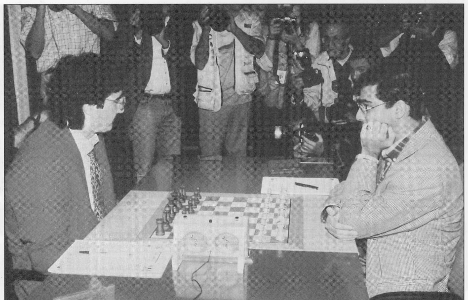
V. Anand (a la izquierda del lector) obtuvo el segundo puesto del Super Torneo, después de Kasparov

por descontado los aficionados, muchos de ellos extranjeros, y las personalidades