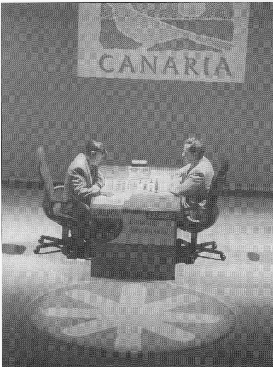
El encuentro entre Kasparov y Karpov fue el más esperado

Para que el Super Torneo Mundial de Ajedrez Gran Canaria'96 haya tenido el éxito que tuvo, todas las opiniones coinciden en que un gran porcentaje de méritos se deben al CICCA, opiniones encabezadas por los seis principales protagonistas, es decir por Gary Kasparov, Anatoly Karpov, Viswanathan Anand, Vladimir Kramnik, Vesselin Topalov y Vassili Ivanchuk, que lo han definido como marco ideal para un certamen de esta magnitud, lo mismo que el Comité Ejecutivo de la Federación Internacional que lo visitó con el Presidente Kirsan Ilyuminov, al mismo tiempo Presidente de la República rusa de Kalmikia, y el Presidente de honor, el filipino Florencio Campomanes que ha sido presidente de la FIDE entre 1982-1995.