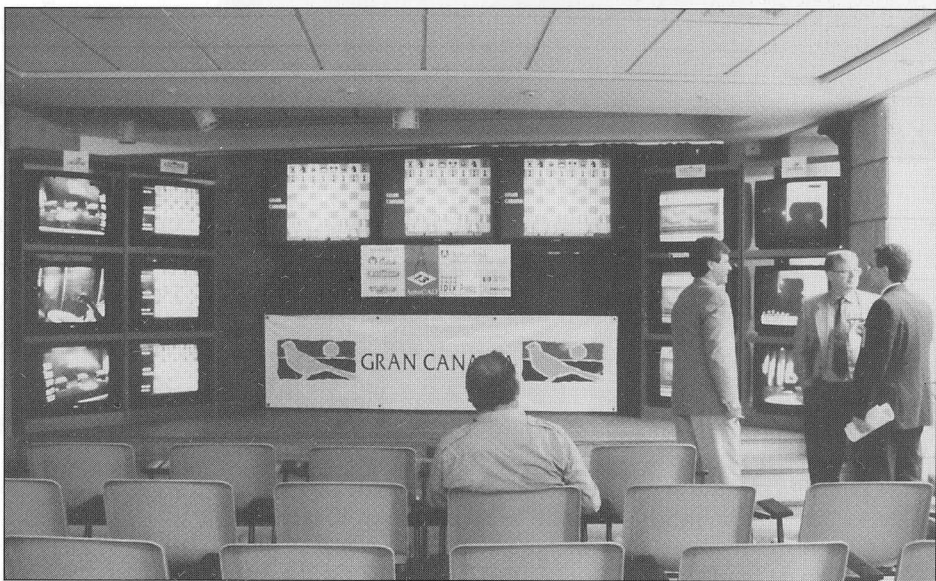
Las fotos recogen varios aspectos del Super Torneo Mundial de Ajedrez Gran Canaria '96 en el CICCA

toda la isla, con desarrollo diario en la Alameda de Colón en la que se sucedían partidas de cinco minutos, de media hora y de una hora de duración. Hubo también la escenificación de una partida de ajedrez viviente y una semana de cine con