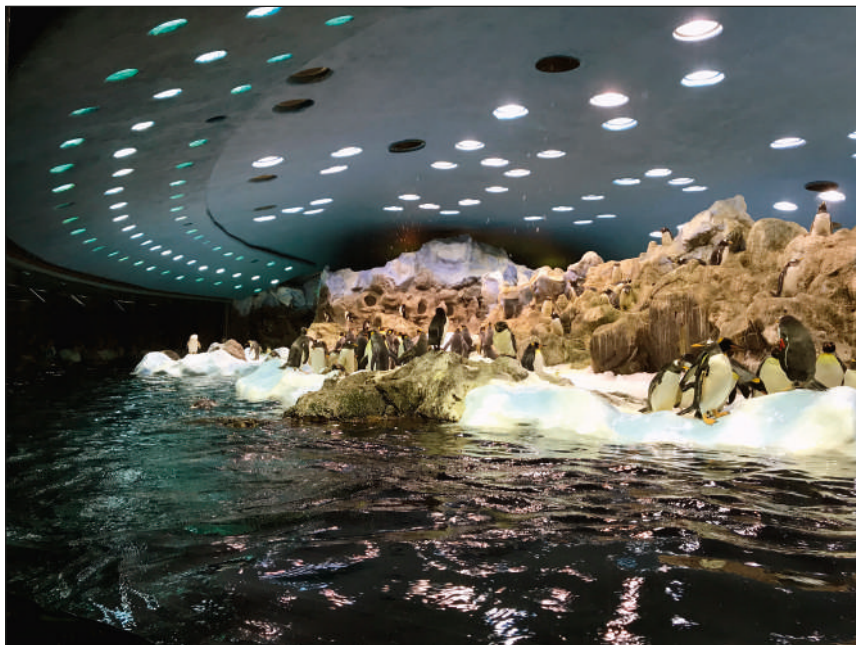
Carmelo Vega. Loro Parque, 2019.