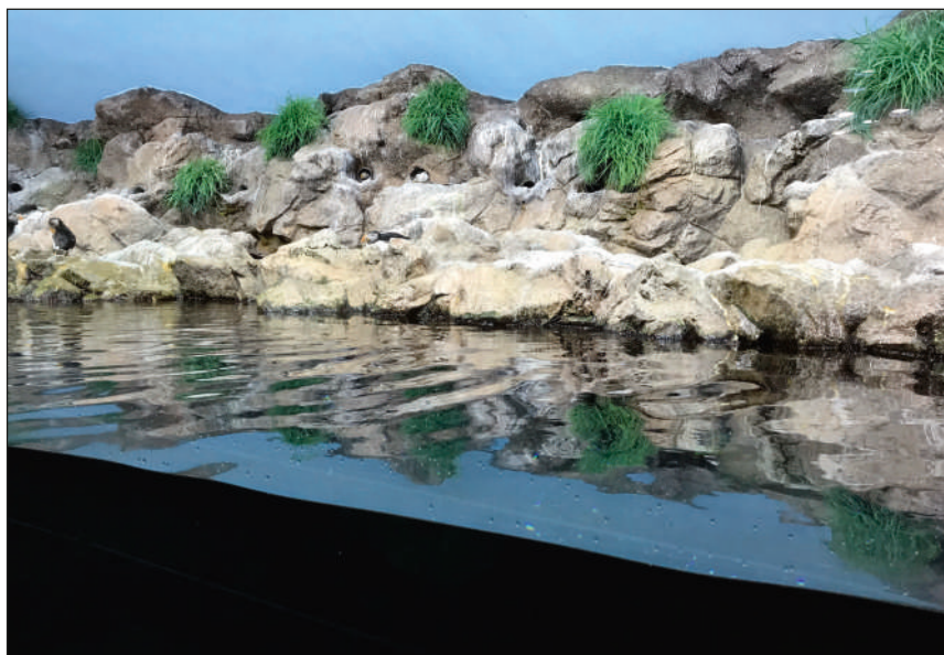
Carmelo Vega. Loro Parque, 2019.