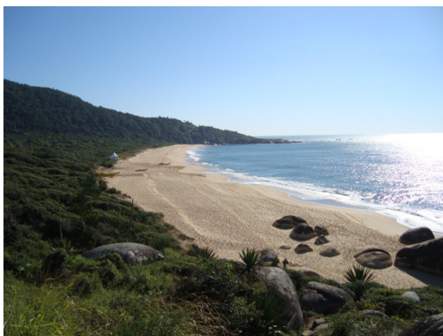
Figura 2: Vista de Taquarinhas.

A Praia do Pinho (Figura 3) é identificada como