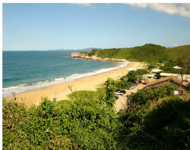
Figura 3: Praia do Pinho.

Existem vários meios de hospedagem na região