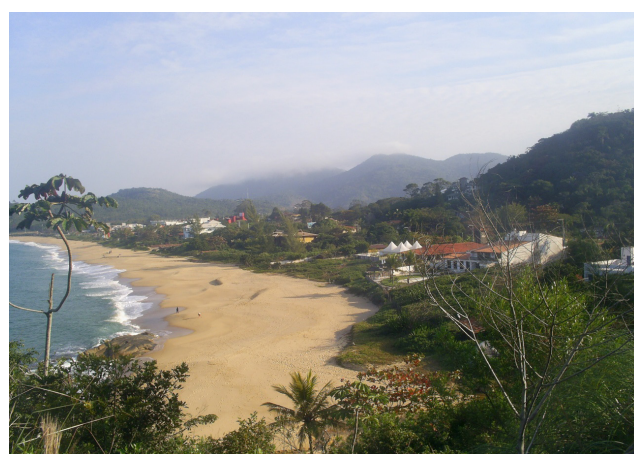
Figura 5: Vista Praia Estaleirinho (Pontal Norte).