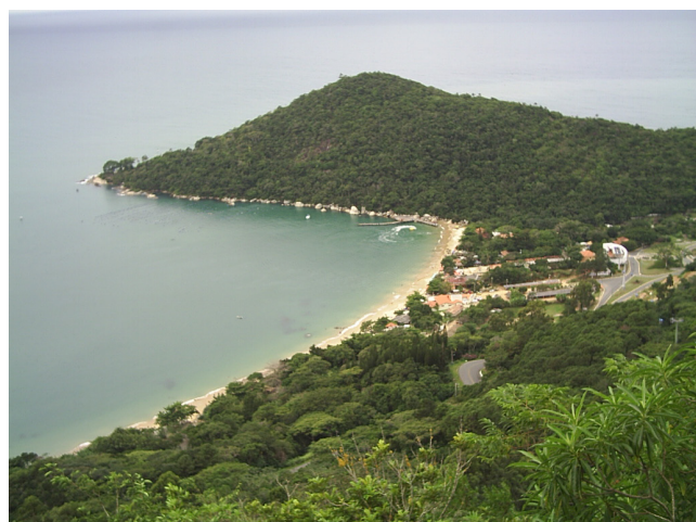
Figura 1: Vista da Praia de Laranjeiras .Fonte: Pesquisa de campo Interpraias (2008)

Em contrapartida, a Praia de Taquarinas (Figura