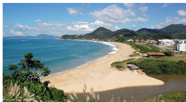
Figura 4: Praia do Estaleiro.