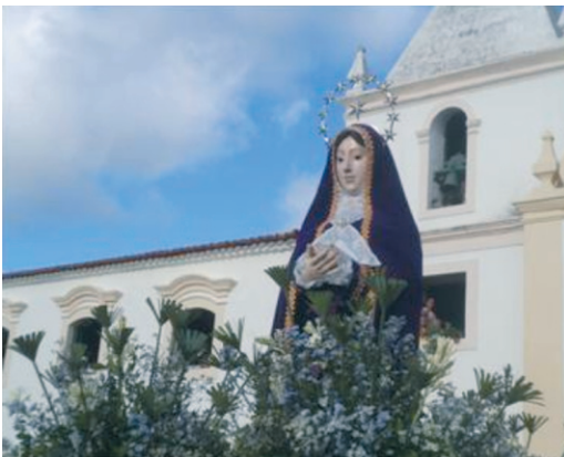
Autor: Ivan Rêgo Aragão (2011)

feita. Nos estudos de Quites (1997, 2007), tanto a imagem de vestir, como a de roca possui articulações, porém ficam escondidas sob a indumentária. “Essas duas categorias geralmente possuem perucas de cabelos naturais e vestes feitas em tecido” (Quites, 1997: 1). No Brasil desde o século XVIII, foram confeccionadas para serem utilizadas nas procissões e servirem para tornar a cena mais realística e dramatizada. Flexor (2003: 529) menciona que em Salvador setecentista,