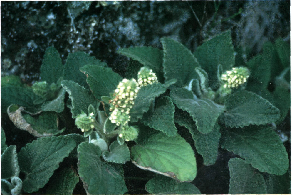
Figura 3.- Sideritis amagroï sp. nov., vista general de la planta.