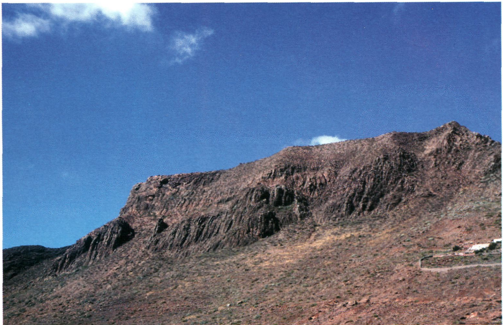
Figura 4.- Escarpes altos de la montaña Amagro, donde crece Sideritis amagroï sp. nov