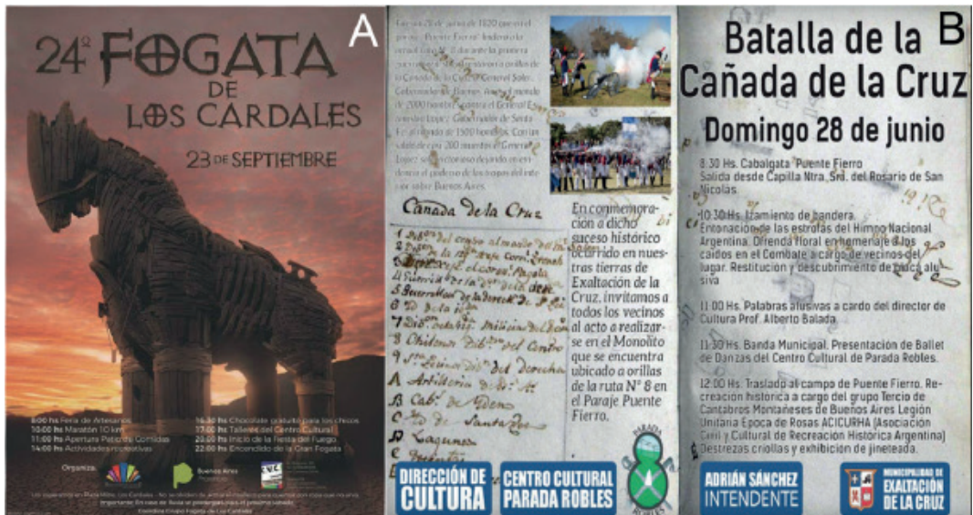
Figura 2: A. Banner de la Fogata de San Juan, Cardales (2017). B. Folleto de la Batalla del Cañada (2014).

La Fogata de San Juan –que anteriormente se organizaba en Capilla del Señor- comenzó a festejarse en 1994 en Cardales. Ella se tornó una actividad multitudinaria a la que se le fueron incorporando otras atracciones como puestos gastronómicos, venta de artesanías y la organización de talleres recreativos para chicos, culminando con la esperada quema del muñeco elaborado para la ocasión. En 2017 se celebró la edición número 24 (Figura 2). Asimismo, reproducciones realizadas -por los miembros del centro cultural de Parada Robles- de la Batalla de la Cañada 5 , resultan eventos culturales locales autogestionados -con apoyo municipal- que terminan siendo resignificados como atractivos turísticos por la Dirección de Turismo. Actualmente, estos eventos forma parte de la agenda de actividades promocionada también por la Subsecretaría de Turismo bonaerense en la Guía de “Fiestas Populares” (SECTUR, 2018), mostrando la relevancia que han adquirido.