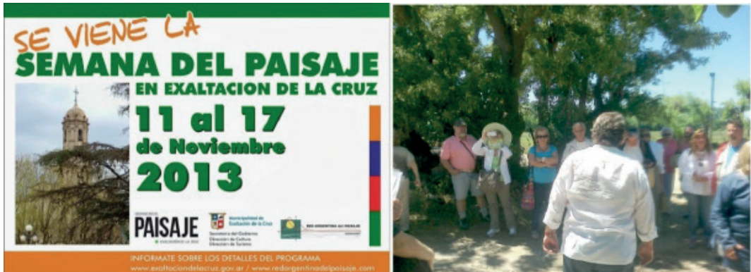
Figura 3: Banner de la inauguración del Observatorio del Paisaje; fotografía sobre la realización de uno de los talleres en las afueras de Capilla del Señor.