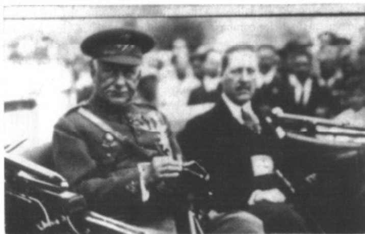
La Sociedad "Fomento y Turismo" fue disuelta en 1928. En este año visitó Las Palmas de Gran Canaria el Presidente del Gobierno General Primo de Rivera.