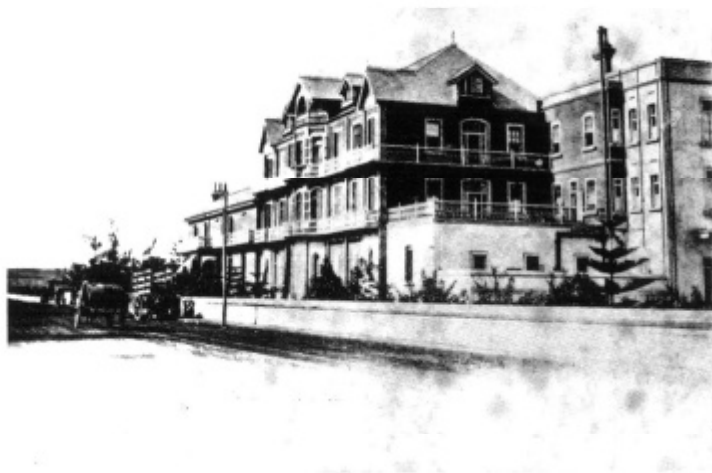
El "Metropole" frente al mar, tenía una bella arquitectura y terrazas con balaustres de madera.