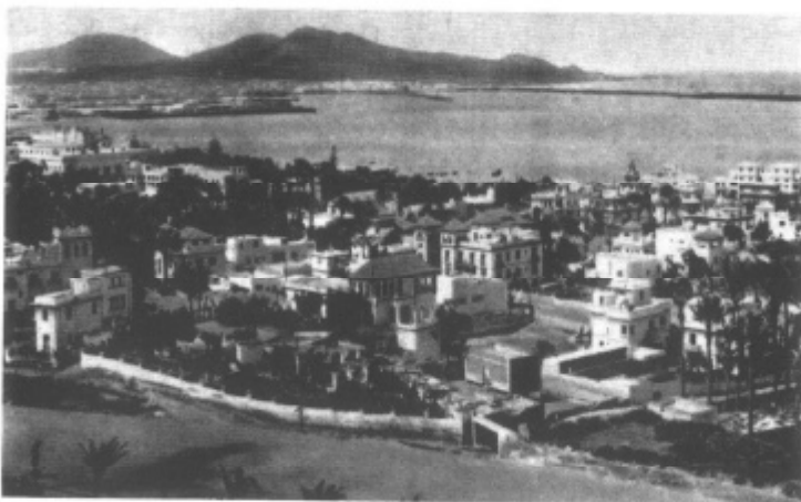
El Ayuntamiento compró parte de la finca de los Sres. Wood de la Torre, ubicación actual del Parque Doramas.