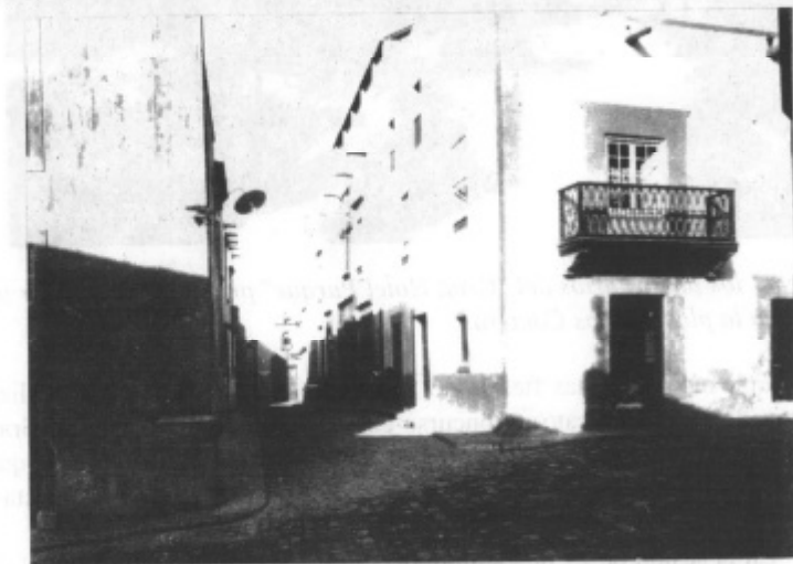
Calle de Colón y Ermita de San Antonio Abad

La situación creada por la guerra mundial supuso una paralización de las actividades turísticas y del movimiento de viajeros, con unas circunstancias económicas nada propicias para un desarrollo de los servicios de la Isla, no obstante el Sindicato de Iniciativas continuó siendo centro de inquietudes y núcleo de toda iniciativa que pudiera mejorar las condiciones de vida en Gran Canaria.