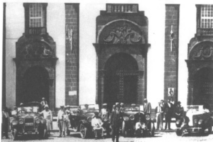
Los turistas que arribaban al Puerto de La Luz hacían excursiones a los pueblos de la Isla.