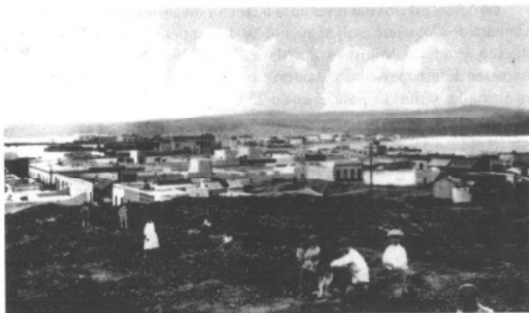
Existía una expansión incontrolada en el barrio del Puerto de la Luz.