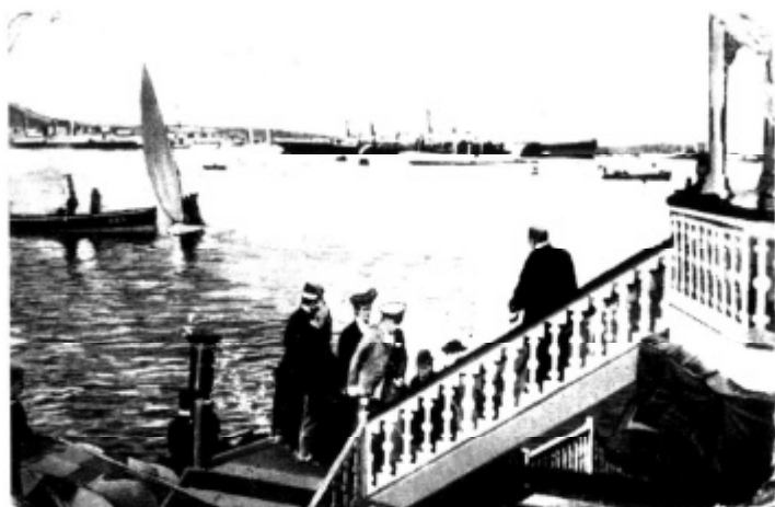
Desembarco de Alfonso XIII en Las Palmas. El 31 de Marzo de 1906, el "Hotel Santa Catalina" se engalanó para recibir al rey.