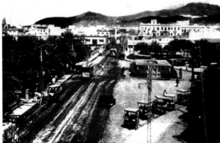
Parque de Santa Catalina. Parada de Tartanas.