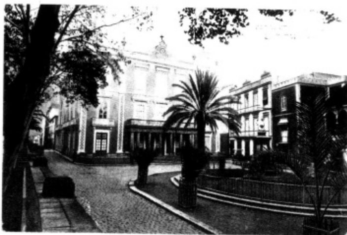
En Julio de 1915 se constituyó la Sociedad "Fomento y Turismo". La primera reunión de la Junta Directiva se celebró en El Gabinete Literario