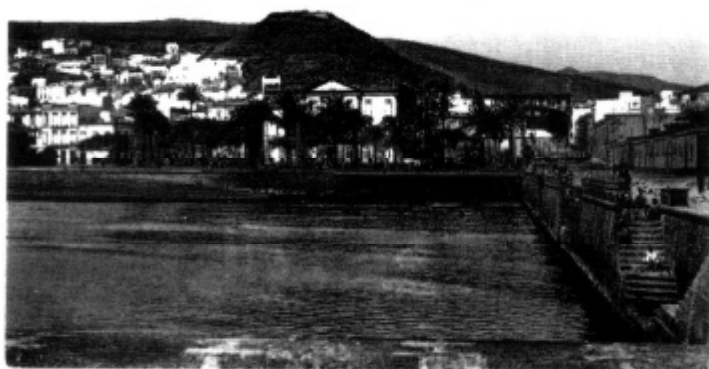
"Fomento y Turismo" proyectó instalar un balneario en la zona del muelle Las Palmas.