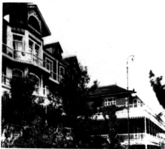
Terrazas y jardines del "Metropole".

Como consecuencia de la guerra de 1914-1918 disminuyó el movimiento de viajeros en el Puerto de la Luz; ya se observaba en años anteriores una notable regresión en el número de turistas, clausurándose por este motivo los Hoteles "Santa Catalina", "Metropol", "Victoria" y "Santa Brígida". Era necesario encauzar la corriente de viajeros que pasaba por nuestro puerto procurando atraerla y retenerla, por lo que era indispensable realizar en Las Palmas de Gran Canaria un programa de reformas, dando impulso a obras de utilidad y ornato público, organizando fiestas populares y de arte que superaran la monotonía en la vida local, pavimentar e iluminar la carretera del Puerto, gran enemiga del turismo por sucia y polvorienta en verano e intransitable en invierno; era del mayor interés realizar una eficaz propaganda del clima y de las bellezas naturales de la Isla.