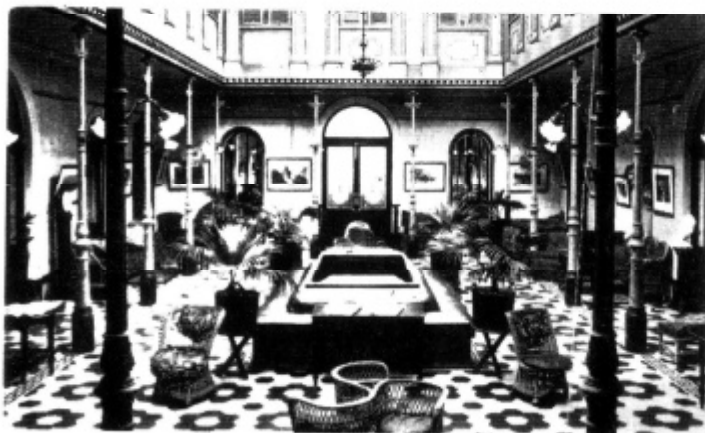
Salones del "Metropole" amueblados con sillería de mimbre.

"Fomento y Turismo" organizó los carnavales de 1916, con un concurso de máscaras y estudiantinas; creó una plaza de intérprete auxiliar de los viajeros para prestar servicios en el muelle de Santa Catalina y posteriormente solicitó y obtuvo de la Junta de Obras del Puerto la apertura de una oficina de información.