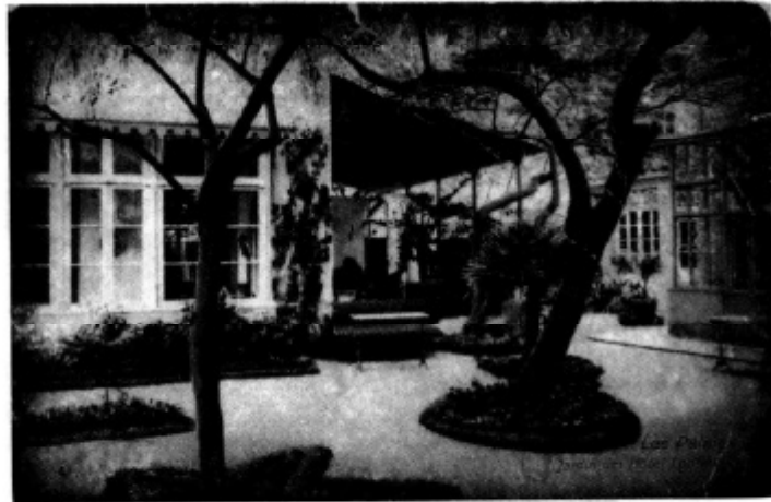
Jardines del Hotel "Continental".

Parque de San Telmo. Se estudió el procedimiento para organizar entre los socios excursiones a distintos lugares de Gran Canaria y la posibilidad de realizarlas a las demás Islas y a la Península. Recabó de los propietarios de casas y solares situados en la Playa de Las Canteras la construcción de un muro de contención, que sirviera para realizar el proyecto de un Paseo Marítimo. El 2 de Julio de 1921 solicitó se estableciera un servicio de policía urbana exclusivo de la Playa, iluminándola, realizando una limpieza diaria y colocando en la calle que la bordea arbolado y bancos. El 19 de Enero de 1919 se acordó telegrafiar al Ministro de Instrucción Pública y representantes en Cortes por la Isla, solicitando la inmediata creación de un Instituto de Segunda Enseñanza en Las Palmas de Gran Canaria.