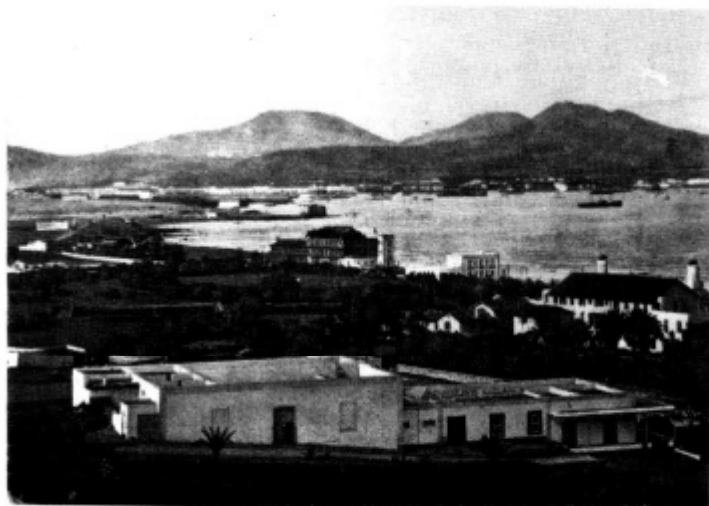
En los primeros años veinte la Ciudad creció hacia el Norte, desapareciendo las fincas de Los Arenales convertidas en manzanas de casas y vías urbanas.