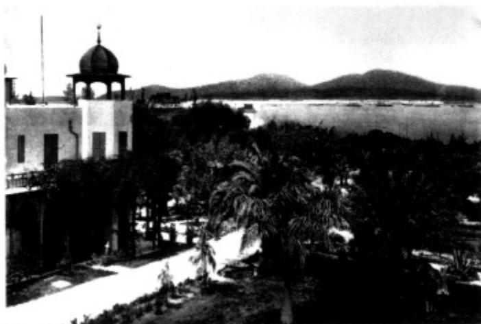
El "Hotel Santa Catalina" tenía un jardín tropical en el que la colonia inglesa organizaba fiestas sociales en la Ciudad del novecientos.