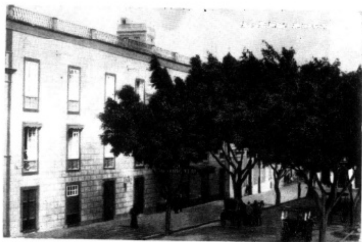
Hotel "Continental" en la Plaza de San Bernardo.

arbolado, de buena iluminación, de urbanización de trasera de la calle Pérez Galdós, el callejón llamado de La Vica, los pilares públicos situados en la Plaza de San Bernardo. Se proyectó publicar un Boletín diario; organizar conferencias para dar a conocer la necesidad de fomentar el turismo; establecer premios anuales en metálico a los que se distinguiera por su protección a los árboles, a la casa mejor construida y de más artística fachada; se acordó redactar una guía de turismo y comunicar diariamente a los periódicos de Madrid la temperatura de la Isla, y cuando el estado económico de la Sociedad lo permitiera abrir un concurso para la adquisición de postales de vistas de los pueblos de la Isla, con indicación de su temperatura en las diferentes estaciones y las distancias de la Capital.