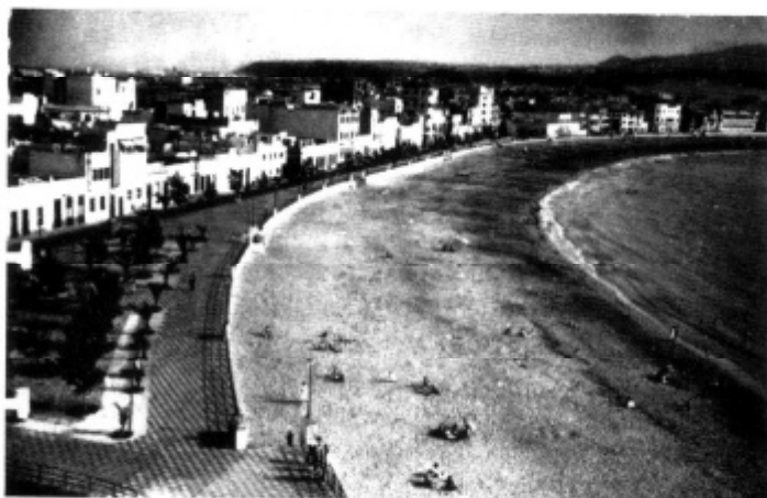
El Centro de Iniciativas y Turismo interesó del Arquitecto Don Miguel Martín-Fernández de la Torre la confección de un proyecto de urbanización y ornato de la Playa de Las Canteras.

taxis, de comerciantes, de proveedores de buques, de algún práctico del Puerto, de la Prensa y de gentes cuya vida económica dependiera del aumento del tráfico marítimo y del paso de viajeros, para movilizar, dirigir y encauzar la corriente de turismo a nuestra Isla.