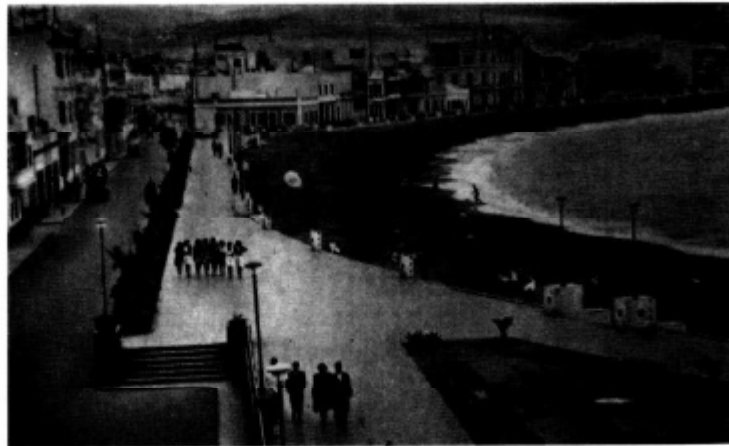
Preocupación del Centro de Iniciativas y Turismo fue el ornato y preocupación de la Playa de Las Canteras.

en el buque "Infanta Beatriz" para visitar las exposiciones de Sevilla y Barcelona. La Prensa local de Julio de 1930, especialmente "El diario de Las Palmas" y "El Defensor de Canarias" acusaban al Patronato Provincial de Turismo de inoperancia ya que no realizaba funciones tan elementales como promocionar a las Islas en las oficinas del Patronato Nacional de Turismo en el extranjero, en otras capitales españolas y proporcionar a las agencias de viajes inglesas datos referentes a Canarias.