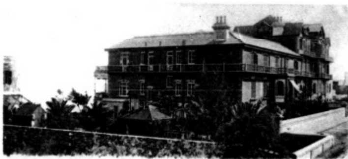
El "Metropole" inaugurado en 1894, edificado por Mr. Alfred L. Jones en representación de Elder.