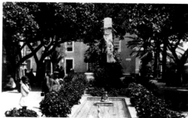
Fachada del Hotel "Monopol" a la popular Plaza de los Patos o de la Democracia