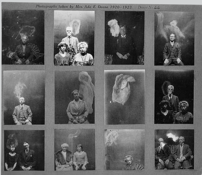
1920-1923. Dozen No 44