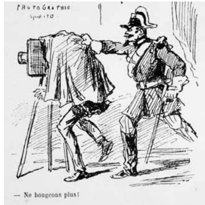
8. Cham [Amédée de Noé], "¡Quieto!", il. extraída de Les Folies parisiennes par Cham, quinze années comiques 1864-1879 , París, Calmann Levy, s. d. p. 39 (colección privada).