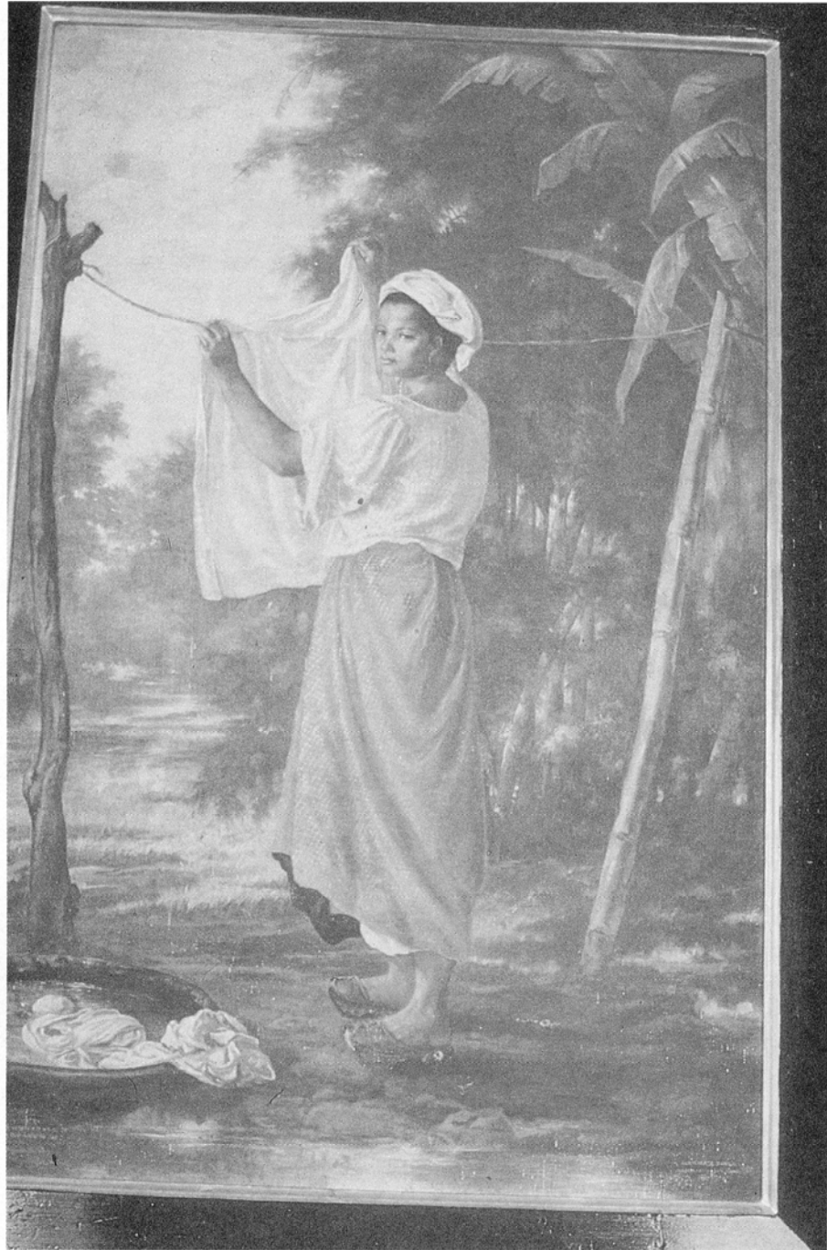
LÁMINA II.—M. ZARAGOZA, La lavandera . O/L.