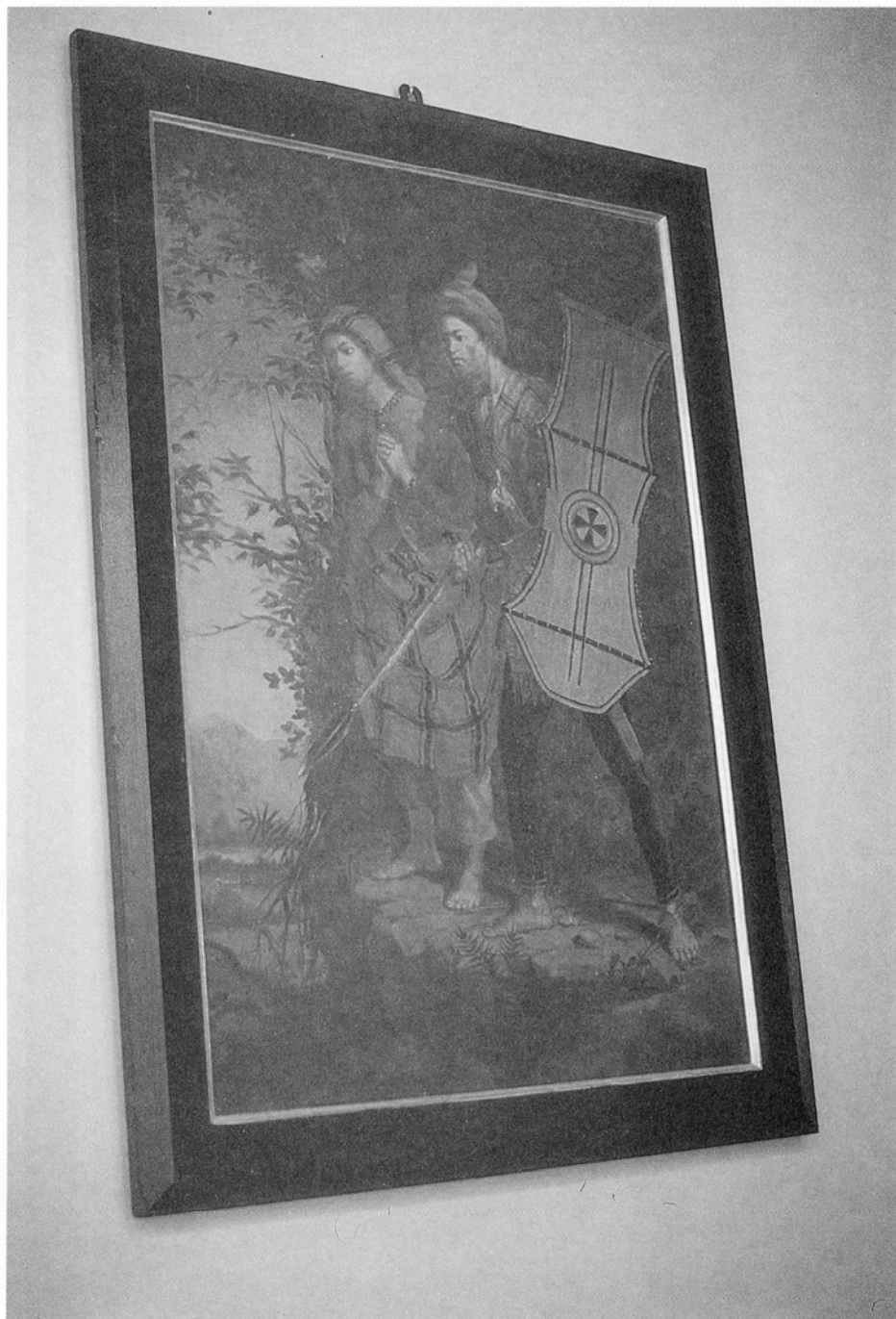
LÁMINA I.—B. MORALES, Personajes filipinos . O/L.