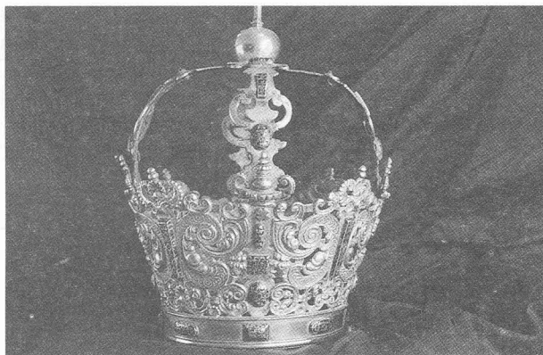
Fig. 3: Corona imperial de plata sobredorada y esmaltes de la Virgen de la Piedad, Trujillo, 1672. Iglesia de Nuestra Señora de Montserrat de Los Sauces.