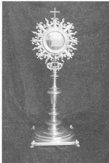
Fig. 2: Custodia de plata sobredorada que perteneció al convento de La Piedad, Trujillo, 1672. Iglesia de Nuestra Señora de Montserrat de Los Sauces.