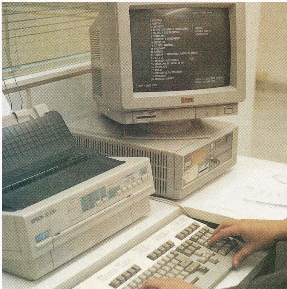
El conocimiento y uso de los ordenadores personales es una de las prioridades de nuestros jóvenes

Aunque podía inscribirse todas las personas que los desearan, a un precio de 3.000 pesetas, el curso está especialmente dirigido a los jóvenes; los de edades comprendidas entre 14 y 18 años que sean titulares de Libretas de Ahorros de La Caja de Canarias y los titulares de Tarjeta Canaria entre 18 y 24 años se benefician de una reducción de esta cuota de inscripción, pues solamente tenían que abonar 1.000 pesetas.