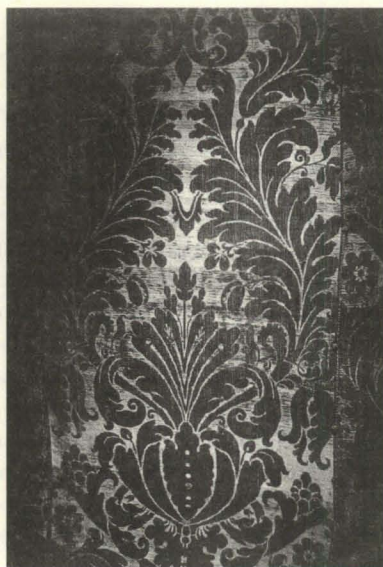
Figura 10. Brocatel. Seda y lino. Siglo XVIII. Tejido para tapizado o colgadura. Decoración vegetal estilizada que ocupa el ancho de la tela. Museo de Arte Sacro. Catedral. La Laguna.