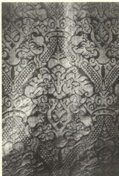
Figura 4. Dalmáticas. Detalle. Damasco de seda. España, anteriores a 1629. Parroquia de San Andrés. Villa de San Andrés y Sauces.

De la misma centuria son otros damascos de diseño vegetal y acusadas geometrificaciones, con ramilletes de flores, granadas y tallos dispuestos en bandas alternativas a derecha e izquierda. Los hay en la catedral de Las Palmas (casulla verde) y en las iglesias de Santa Ana de Garachico (ternos verde y morado; fig. 5); la Concepción del Realejo Bajo (ternos morado y rojo); Santiago del Realejo Alto (manga de cruz roja); Santiago de Gáldar (terno morado); San Pedro del Mocanal (casulla morada); y San Miguel de Tazacorte (casulla verde conocida como «de los Mártires»). Sus dibujos son iguales a los del terno bordado del monasterio de San Isidoro de Santiponce (Sevilla), con fondos de damasco rojo y blanco de la primera mitad del siglo XVII 70 ; y a los de las dalmáticas y casulla del Terno de la Conquista de la parroquia de El Salvador de Santa Cruz de La Palma, anteriores a 1687, año en el que se sustituyó el brocado original por damasco carmesí, pero conservando las cenefas en terciopelo bordado 71 .