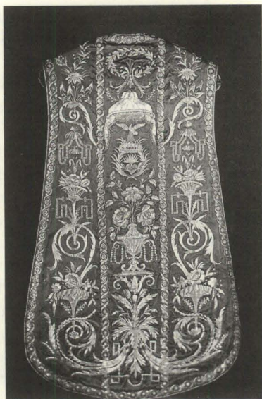
Figura 9. Casulla. Pontifical rojo del arzobispo de Heraclea. Raso bordado en oro y plata. Madrid, c. 1817. Museo de Arte Sacro. Catedral. La Laguna.