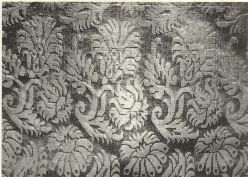
Figura 5. Terno morado. Detalle. Damasco de seda. España, primera mitad del siglo XVII. Decoración vegetal geometrizada de pequeñas dimensiones. Parroquia de Santa Ana. Garachico.

miendos —testimonio de su antigüedad—; y los damascos existentes en el Realejo Alto (casullas verdes); Realejo Bajo (casulla roja); San Marcos de Icod (casulla morada); y El Salvador de Santa Cruz de La Palma (manto de San José del Nacimiento). Estos últimos, similares al núm. 5435 del Museu Tèxtil de Terrassa (España, siglo XVII), introducen como principal diferencia la figura heráldica de la flor de lis 73 . Como en los casos anteriores, creemos que se trata de damasco de España (tejido en Granada, Sevilla, Valencia o Toledo), citado con frecuencia en cuentas de fábrica e inventarios del siglo XVII. Al respecto, en 1673, el obispo García Ximénez recomendaba que los ornamentos del culto divino se hiciesen con damasco «de España y no de Ytalia, por la mayor duración» 74 .