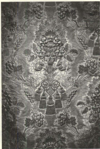
Figura 8. Terno de tisú. Detalle. Oro, plata y sedas. Lyon, c. 1830. Parroquia de Santa Ana. Garachico.