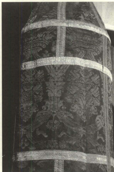
Figura 2. Manga de cruz. Damasco de seda. España (Granada, Sevilla, Valencia o Toledo), siglos XVI-XVII. Decoración vegetal geometrizada dentro de redes lanceoladas entrelazadas por coronas. Catedral. La Laguna.