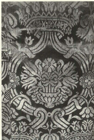
Figura 3. Frontal de altar. Detalle. Damasco de seda. España, siglo XVII. Parroquia de Nuestra Señora de Candelaria. Tijarafe.

Por lo que respecta a los telares de las Islas, las cuentas de fábrica de la antigua parroquia de los Remedios (1760-1779) recogen la compra de 15 varas de «tafetán tornasolado y morado de Ycod», a 6 reales plata la vara, para tres casullas para el tiempo ordinario; 23 varas de «tafetán amarillo de Ycod», a 5 reales la vara para un terno nuevo de damasco blanco; 10 varas de «tafetán negro de Ycod» para composición de la «capa antigua; tafetán listado» para dos dalmáticas nuevas de los