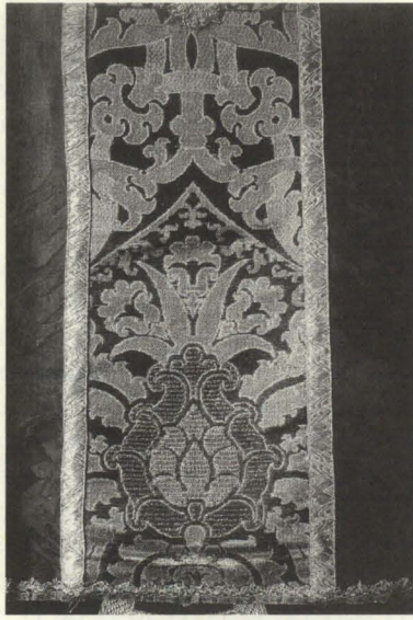
Figura 1. Casulla de San Andrés. Detalle de la cenefa de brocatel con oro y plata anillada. Toledo, siglo XVI. Decoración con piña central de ascendencia gótica. Parroquia de San Andrés. Villa de San Andrés y Sauces.

les; la casulla de brocatel amarillo y rameados en rojo —con piña central— de Santa Catalina de Tacoronte (siglos XVI-XVII), forrada en lienzo — holandilla — con curiosas flores estampadas 5 ; el terno morado conocido como de Juana la Loca de la catedral de Las Palmas, labrado con motivos vegetales geometrizados formando óvalos en oro (siglos XVI-XVII); y la casulla que el licenciado Mateo Fernández de la Cruz Piñero donó en su testamento, en 1724, a la parroquia de San Pedro de Breña Alta, de raso encarnado con ramos de oro y plata geometrizados y dispuestos en sembrado (siglo XVII) 6 .