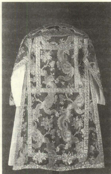
Figura 6. Dalmática (terno morado). Tejido labrado en sedas, oro y plata. ¿Valencia? C. 1760-1780. Decoración de meandros con cintas de imitación de encajes y ramilletes de flores espolinadas. Museo de Arte Sacro. Catedral. La Laguna.