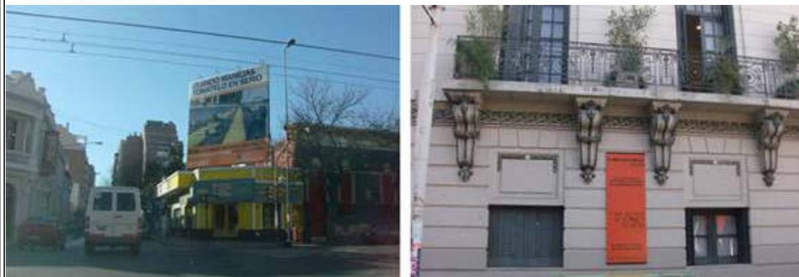
Figura 3. En la imagen de la izquierda, publicidad exterior de la campaña contra los riesgos de la conducción. En la imagen de la derecha, anuncio del Consejo Provincial de la Mujer como centro de ayuda contra la violencia sexual. Ciudad de Córdoba (Argentina).

El tercer sector ha ocupado los espacios dejados por la crisis permanente del estado del bienestar ante la falta de soluciones a problemas sociales por parte de la Administración, y que sirve para descargar la responsabilidad social en otros agentes o en los propios ciudadanos y que se ofrece como alternativa para solucionar dichos problemas o como promesa para hacernos creer que se pueden solucionar la mayoría de las causas sociales. (Alvarado y de Andrés, 2009).