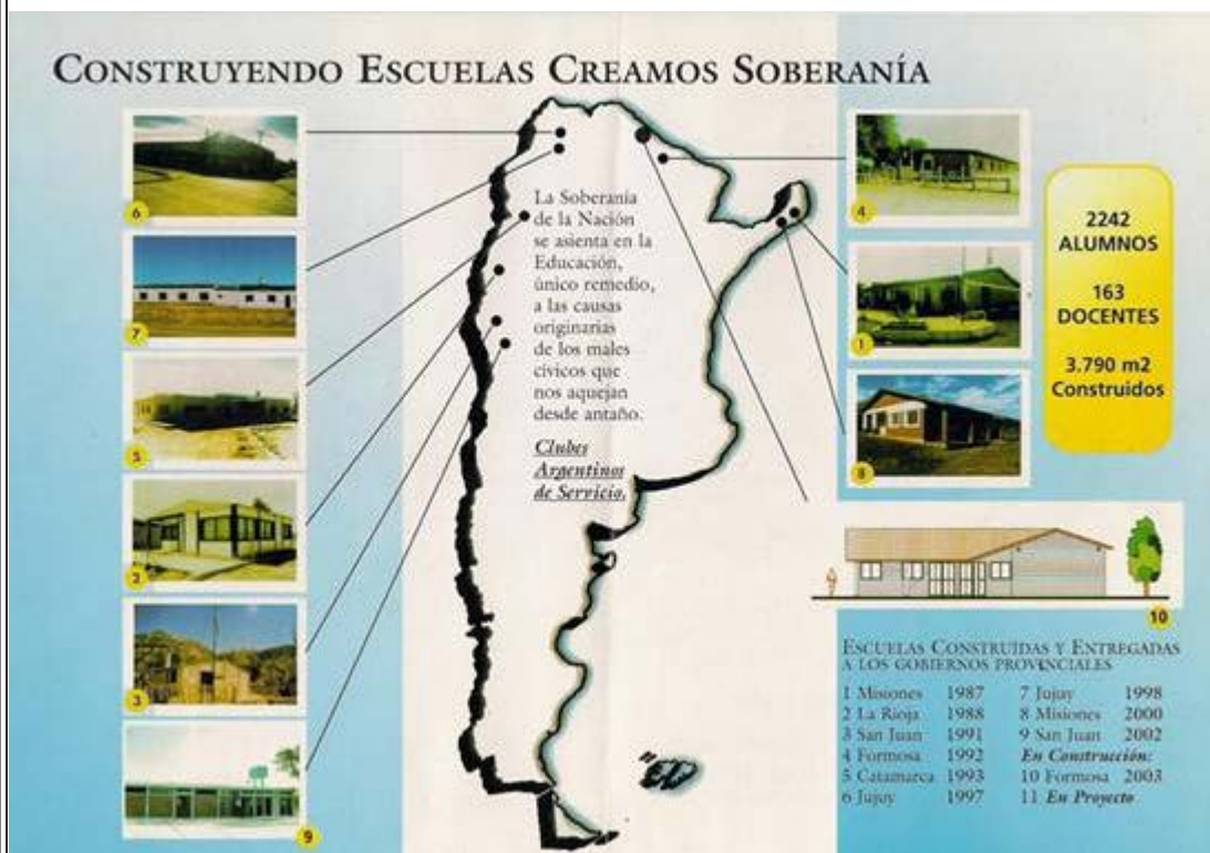
Figura 2. Publicidad social de Acas (Asociación de clubes argentinos de servicios).

Todas estas organizaciones han sentido como propios los seis objetivos que tradicionalmente se ha aplicado a la publicidad de las ONG: Dar a conocer la organización, mejorar su imagen de credibilidad y transparencia, captar fondos y recursos, reclutar nuevos voluntarios y fidelizar a los antiguos, sensibilizar sobre las causas sociales y finalmente educar para cambiar las actitudes insolidarias y reforzar las solidarias. (Ortega: 1997; Martínez, J.L: 2009).