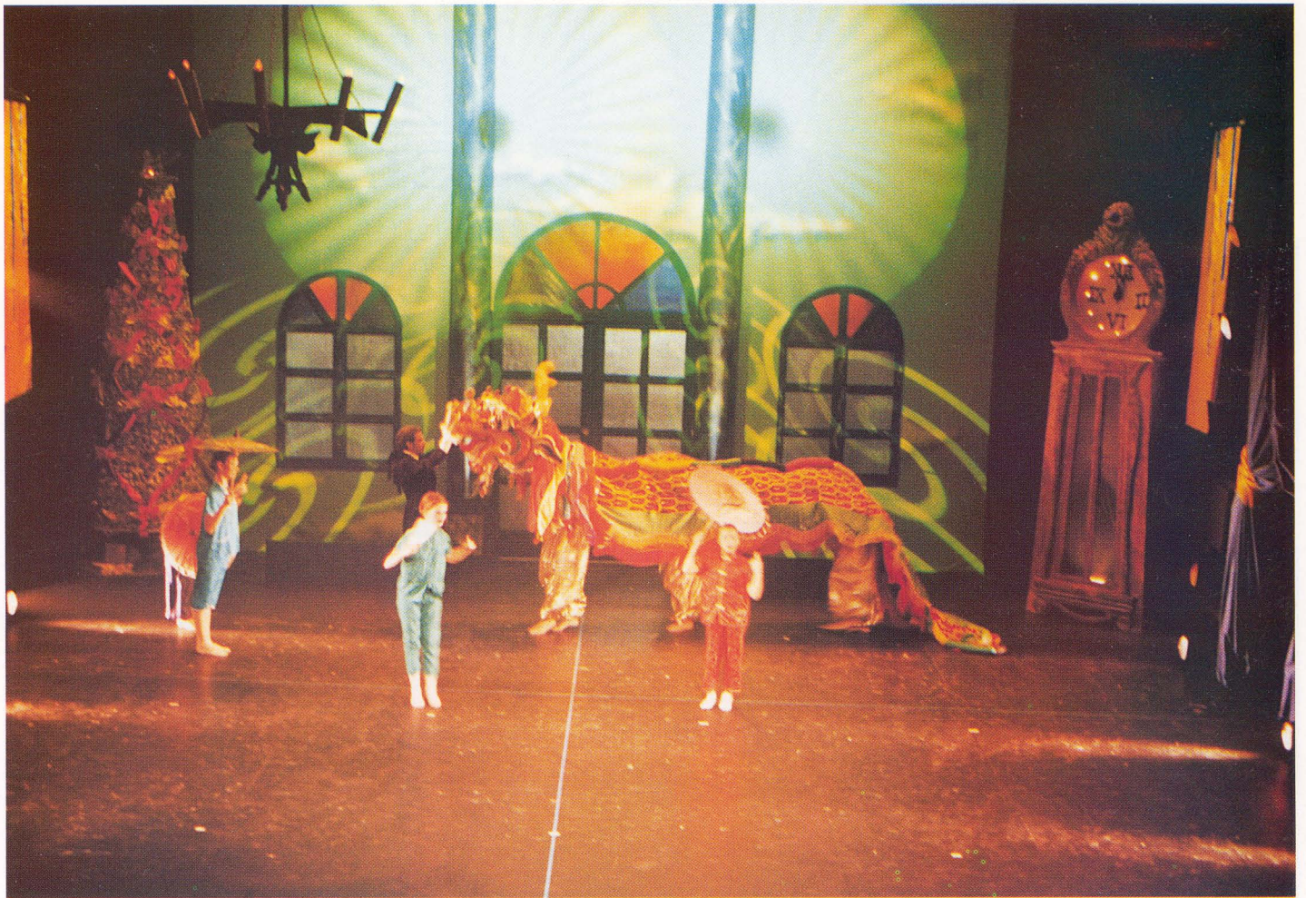
La "Danza china" revistió una especial espectacularidad