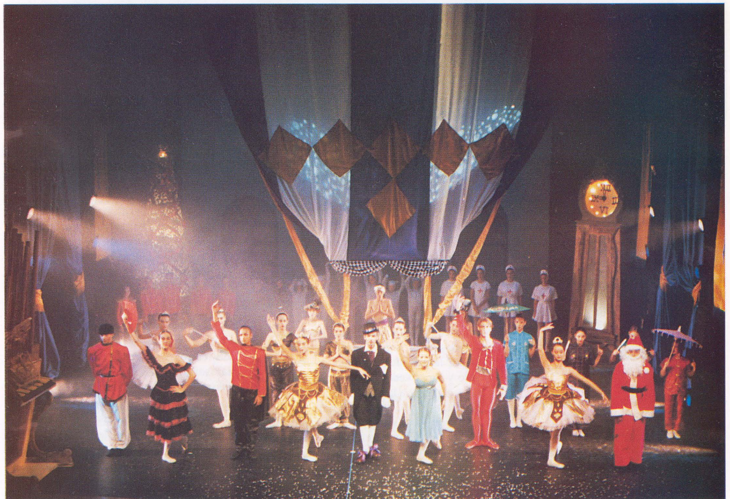
Apoteosis final de la representación de "Cascanueces" en el teatro del CICCA, en Las Palmas de Gran Canaria