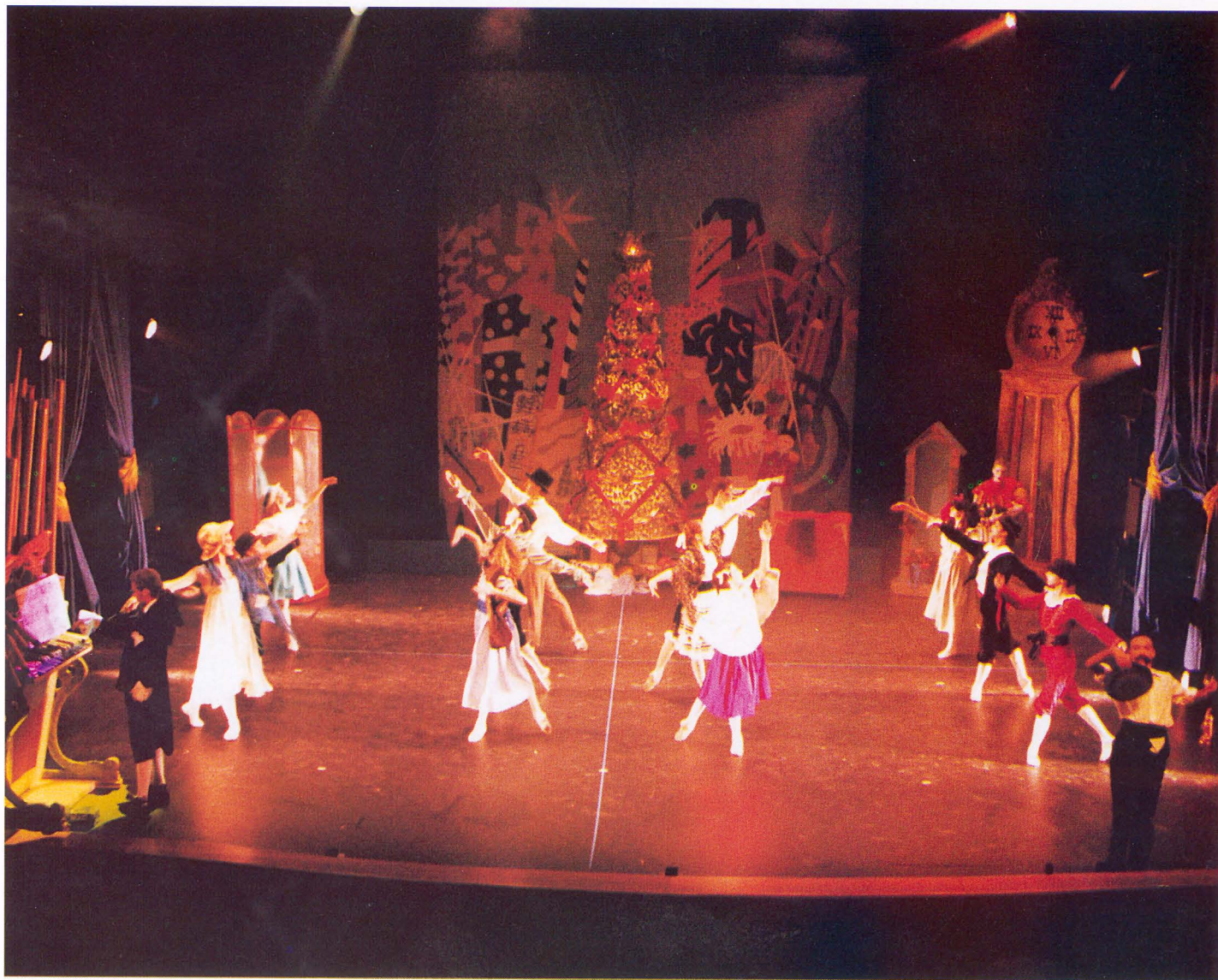
Baile de salón del primer acto del ballet “Cascanueces”, música de P. Tchaikowsky y coreografía de M. Petipa

LA ESCUELA DE DANZA DE LA CAJA INTERPRETO, POR CUARTO AÑO CONSECUTIVO, UNA SELECCION DEL CÉLEBRE BALLET