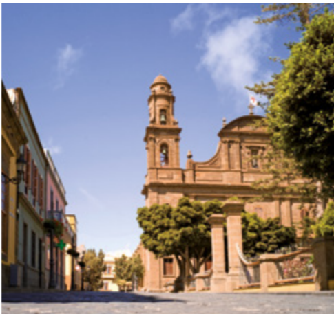
Plaza de Santiago Apóstol.