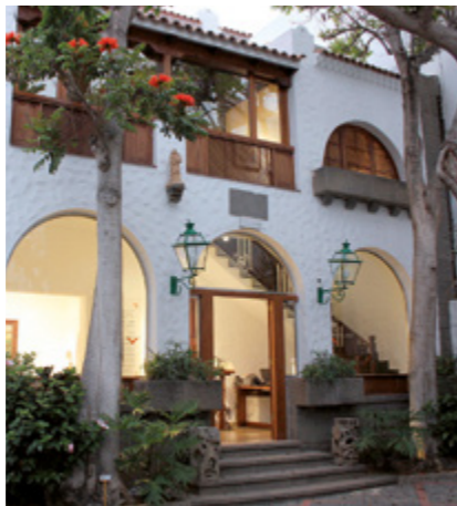
Casa Museo Antonio Padrón - Centro de Arte Indigenista.

El recinto de la plaza se ennoblece hacia el poniente con el Templo Arciprestal de Santiago, pieza principal en la historia del arte canario por constituir el inicio del estilo neoclásico en las islas. Construido entre 1778 y 1826. En su interior se encuentra la Pila Verde, donde fueron bautizados la mayor parte de la población prehistórica. La colección de arte de la Iglesia se completa con interesantes obras de imaginiería, pintura, ornamentos y orfebrería de diversos estilos, así como otras piezas de especial singularidad en el Museo de Arte Sacro de Gáldar, al que se accede desde la calle lateral Fernando Guanarteme."