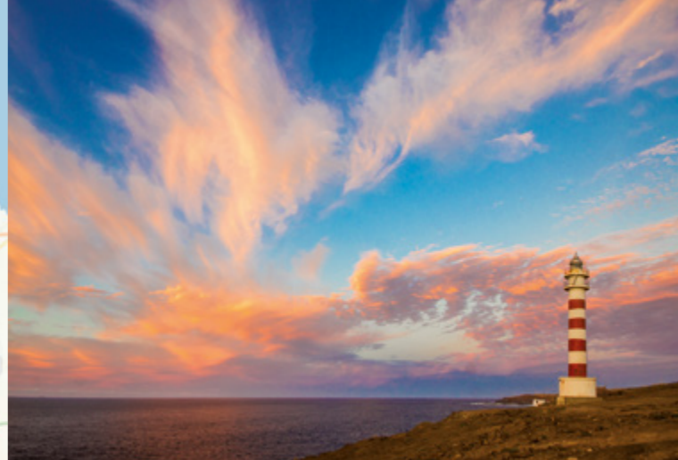
Faro de Sardina.

Al sur de la Plaza, está situado el antiguo edificio dieciochesco de las Casas Consistoriales , sede oficial del Gobierno Local y en cuyo patio se puede contemplar el ejemplar de Drago más antiguo de la isla, documentado hacia 1718. Con acceso desde este edificio se encuentra el Teatro Consistorial, fundado hacia mitad del s. XIX, cuya imagen actual responde a una rehabilitación reciente, aunque el proyecto siendo de 1.912, es uno de los mejores teatros históricos de todo el Archipiélago.