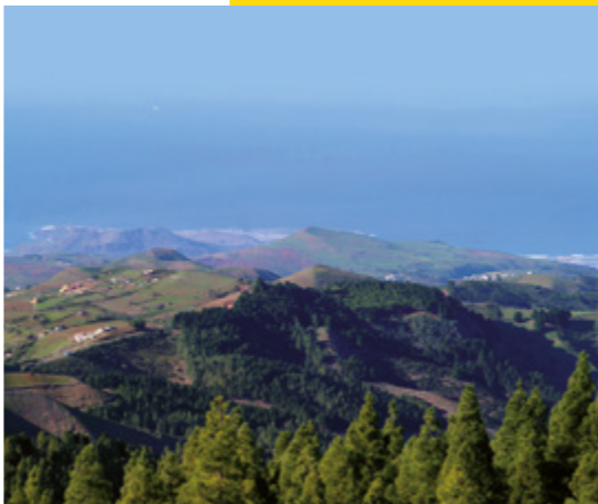
Caldera Pinos de Gáldar.