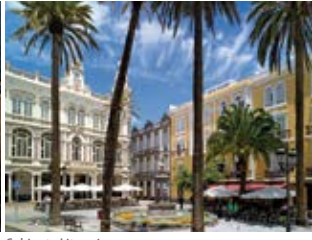
Gabinete Literario (Triana)