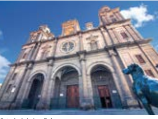
Catedral de Las Palmas (Vegueta)