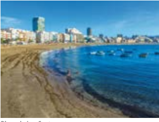
Playa de Las Canteras