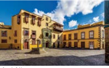
Casa de Colón (Vegueta)