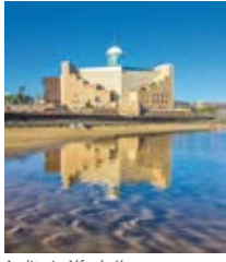
Auditorio Alfredo Kraus (Playa de Las Canteras)