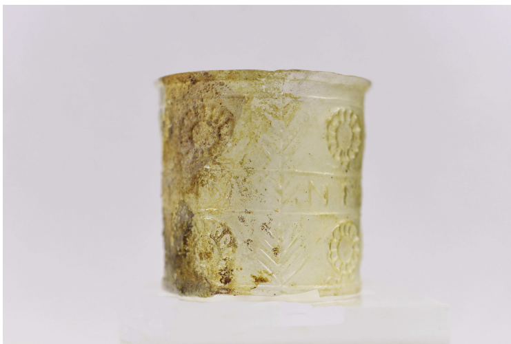
Εικ. 4β. Κύπελλο Γ91 (ΕΦΑ Χανίων - Δ. Τομαζίνάκης).

1944-45:94). Αναφέρεται επιπλέον ένα θραύσμα που σώζει τμήμα επιγραφής [HN], από τάφο στην Ιερουσαλήμ στο μουσείο Rockefeller, κατασκευασμένο από αμφιλεγόμενη μήτρα. Εάν είναι τμήμα της λέξης THN το κύπελο ανήκει στην παραλλαγή με κανονικό N , ενώ αν είναι η κατάληξη της λέξης NEIKHN , το κύπελλο είναι κατασκευασμένο από την μήτρα με το ανάποδο N . 13