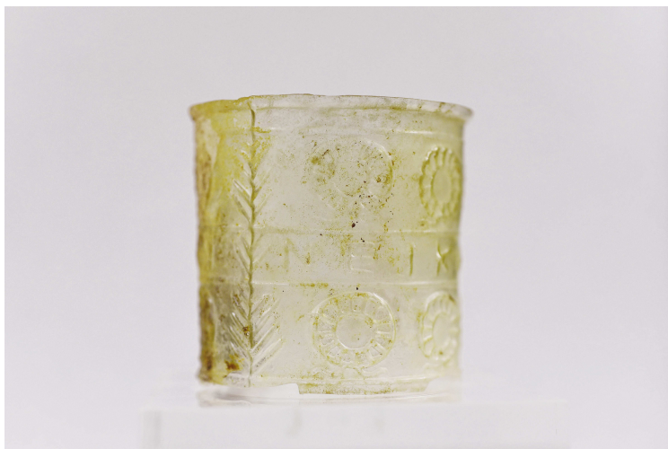
Εικ. 4γ. Κύπελλο Γ91 (ΕΦΑ Χαλίων - Δ. Τομαζινάκης).