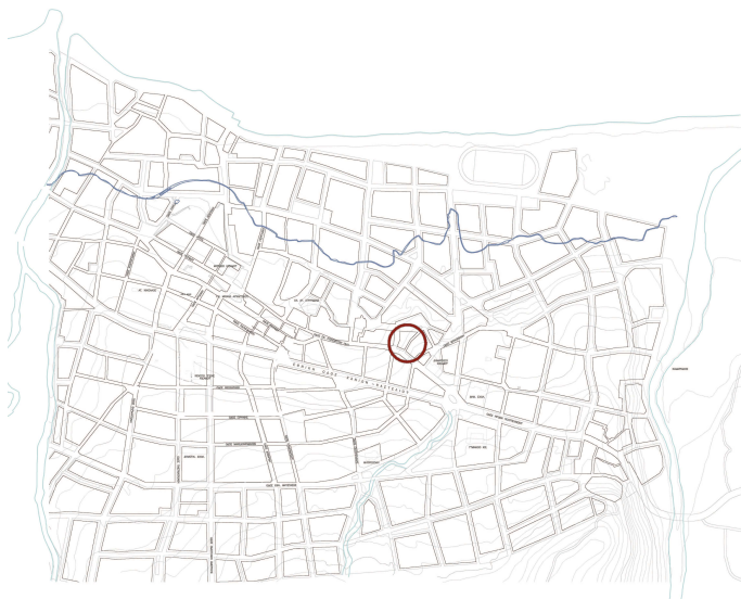
Εικ. 2. Απόσπασμα χάρτη της πόλης με τη θέση του νεκροταφείου.

Τεχνική: Εμφύσηση σε μήτρα. Χύτευση με χρήση κλειστής τριμερούς μήτρας, στο εσωτερικό της οποίας υπάρχει εσώγλυφος διάκοσμος, που αποτυπώνεται στην εξωτερική επιφάνεια του παραγόμενου αγγείου. Η μήτρα αποτελείται από δύο κάθετα κοίλα τμήματα που ενώνονται σε επίπεδο πυθμένα και τη βάση. Η τεχνική της πολυμερούς μήτρας εφευρέθηκε και εξελίχθηκε, προκειμένου να παραχθούν προϊόντα που μιμούνται μετάλλια πρότυπα με σφυρηλάτο διάκοσμο. 7