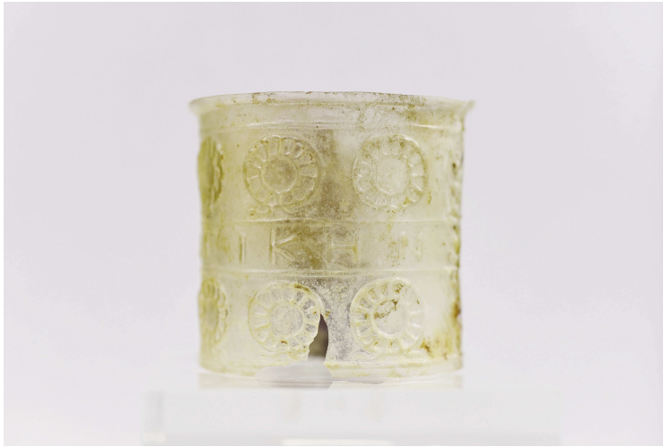
Εικ. 48. Κύπελλο Γ91 (ΕΦΑ Χανίων - Δ. Τομαζινάκης).