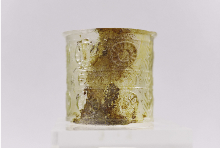
Εικ. 4α. Κύπελλο Γ91 (ΕΦΑ Χανίων - Δ. Τομαζινάκης).

με κύριο διακριτό χαρακτηριστικό το ανάποδο N στη λέξη THN , ένα σύνθετος λάθος κατά τη χάραξη του γράμματος στη μήτρα, με αρκετά παραδείγματα να έχουν βρεθεί ενώ στη δεύτερη υποκατηγορία με το σωστό N να είναι καταγεγραμμένα ελάχιστα (Stern, 1995: 98-99· Whitehouse, 2001: 26).