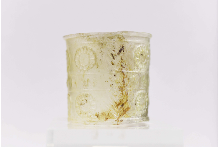
Εικ. 4ε. Κύπελλο Γ91 (ΕΦΑ Χανίων - Δ. Τομαζινάκης).