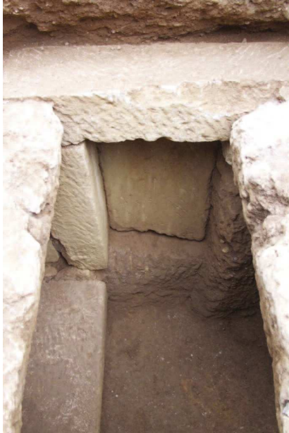
Εικ. 3. Άποψη του τάφου από την οροφή (ΕΦΑ ΧΑΝΙΩΝ).

τρεις φορές σε κάθε πλευρά. Από ένα κάθετο κλαδί φοίνικα στις δύο διαμετρικά αντίθετα πλευρές του, κρύβει την γραμμή της κατακόρυφης ένωσης κατά μήκος των κομματιών της τριμερούς μήτρας, από το χείλος στη βάση. Η επιγραφή ΛΑΒΕ ΤΗΝ ΝΕΙΚΗΝ είναι γραμμένη ανορθόγραφα, με σύνθημα υπέρ της επιτυχίας του χρήστη. Το ορθογραφικό λάθος της φράσης εξηγείται στο πλαίσιο ενός φωνητικού φαινομένου, τον Ιωτακισμό, που παρατηρείται στην ύστερη ελληνιστική εποχή, όπου οι απλοί άνθρωποι μπερδεύουν τα ομόηχα φωνήεντα ή διφθόγγους, συγχέοντας συχνά το ι με το ει .