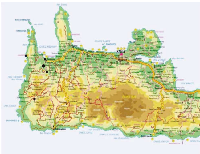
Εικ. 1. Χάρτης.

νεκρικό ένδυμα, ενώ τα χάλκινα αποτμήματα και τα μολύβδινα ελάσματα αποτελούσαν επένδυση ξύλινων κιβωτιδίων και άλλων εξαρτημάτων, αντίστοιχα. Από τη μέχρι σήμερα συντήρηση του υλικού έγινε δυνατή η ταύτιση περισσότερων από σαράντα γυάλινων αγγείων, τα οποία σώζονται σε αποσπασματική κατάσταση. Αναγνωρίστηκαν αγγεία μυροδόχα και κύπελλα, η πλειονότητα των οποίων ανήκει σε κοινούς και διαδομένους τύπους με την τεχνική του ελεύθερου φυσήματος, που εμφανίζονται και επικρατούν από το 1 ο αι. μέχρι τον 3 ο αι. μ.Χ., στην Κρήτη και σε ολόκληρη τη λεκάνη της Μεσογείου. Μεταξύ των αγγείων απαντούν χυτροειδή κύπελλα, σφαιρικά με ευρύ χείλος και κοντό λαιμό 6 και τετράπλευρα με καμπυλωτά περιγράμματα και ελλειψοειδείς εμβάθυνσεις ενώ ξεχώρισε το άωτο κυλινδρικό κύπελλο με την ανάγλυφη διακόσμηση. Βρέθηκε τοποθετημένο όρθια στην περιοχή του κρανίου στο βόρειο θρανίο του τάφου, όπου εκεί διαπιστώθηκε ότι τα οστά ανήκουν σε δύο τουλάχιστον σκελετούς (ταφή 2, Α7).