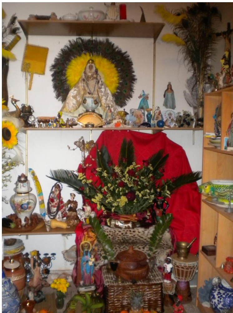
FOTOGRAFÍA 2. Trono de Changó (Santa Barbara) Arafo. Tenerife. Autora: Greyc Pérez Amores.