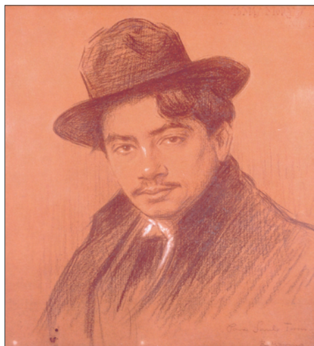
Retrato de Tomás Morales, Madrid, 1905. Eladio Moreno Durán. Carboncillo sobre papel, 27'5 x 30'5 cm. Fondo artístico de la Casa-Museo Tomás Morales. Cabildo de Gran Canaria.

Más allá de las poses afectadas, del atuendo y desaliño intencionados, incluso de los coqueteos con las noches madrileñas y sus posibilidades, Tomás Morales no perteneció a ninguna de los tipologías que inventariara en su día el citado Carrere: ni bohemio pintoresco, ni bohemio tabernario, ni bohemio lúgubre. A Tomás Madrid y su atmósfera lo animaron, por supuesto, a sumarse al juego del escapatismo estético, pero apenas modificaron lo esencial de aquel espíritu libre y errante que venía gobernando su personalidad; si acaso, como explicaré a continuación, contribuyeron a dotarlo, paradójicamente, de método, de sistema de trabajo. Cabría antes preguntarse: ¿qué suerte de componente bohemio llevaba ya Tomás inherente a él, cuando llega a la capital por excelencia de la bohemia hispánica? Tal vez aquel mal estudiante que fue siempre, sacando adelante sus asignaturas con más pena que gloria, nos da la medida de su naturaleza bohemia. Y es que ese alumno huidizo del estudio, aquellos incalculables minutos de miradas al techo, su permanente trueque de la disciplina por el ideal, del menudo escritorio por la cama de la habitación (único gabinete posible para todo bohemio), en suma, aquella “laxitud soñolienta” incompatible con la dictadura de la silla y el