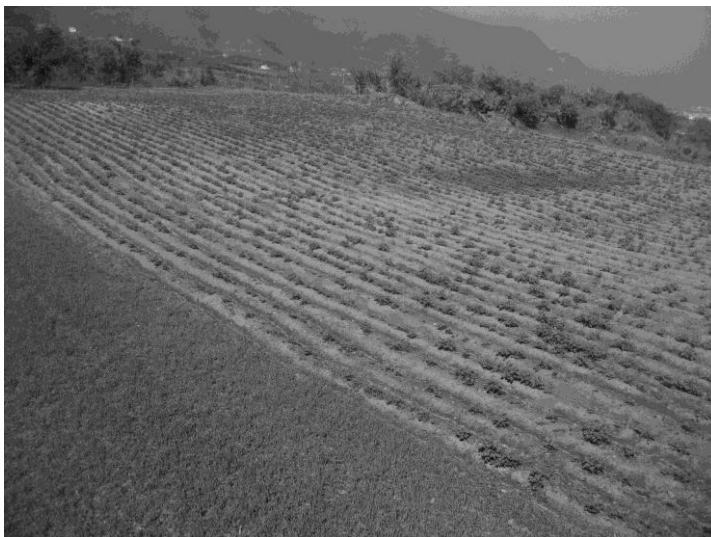
Figura 1. Ejemplo de cómo las cárcavas son procesos de erosión efímeros. En la figura 1 a, campos de cultivos el 17 de noviembre de 2009 tras las lluvias, en la figura 1 b, el mismo campo de cultivo en marzo de 2010.