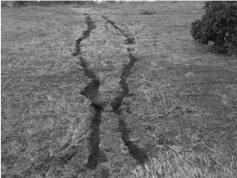
Figura 3. Ejemplo de cárcavas sobre cereal recién cortado en noviembre 2009.

parcela en el momento de las fuertes precipitaciones. Por tanto, se observa que no todas las superficies cultivadas son igualmente propensas a la formación de este tipo de procesos. Todas las cárcavas tienden a localizarse en las depresiones de los campos de cultivos, coincidiendo con los fondos del canal lávico y relacionadas con saltos de pendiente; estos últimos los introducen las paredes que individualizan cada una de las parcelas, que pueden alcanzar hasta 5 m de altura. Las cárcavas sobre cereal cortado (A) suelen ser de cauces lineales, con perfiles en U y poco profundas (fig. 3). Las localizadas en cultivos de millo (B) disponen de cauces sinuosos como consecuencia del obstáculo que suponen las plantas de maíz, dendríticos, con perfiles en U, a veces en V, y con marmitas. Los gullies en cultivo de papas (C) son lineales, anchos, con perfiles en U y rompen los surcos, por lo que estos se disponen perpendicularmente a la cárcava frenando la escorrentía. Los localizados en parcelas de cereal recién nacido (D) son consecuencia de una escorrentía laminar y no concentrada, aún así son dendríticos, anchos y poco profundos. Por último, los de parcelas sin cultivar (E) son lineales, con perfiles en U y con presencia de marmitas (tabla 1).