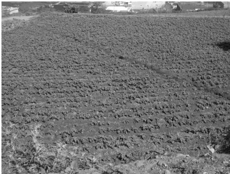
Figura 5. Ejemplo de realización de zanjas-aliviaderos en las parcelas en marzo de 2010.

impidiendo los procesos de escorrentía, ya que evacuaban las aguas hacia los barrancos, depresiones o a los caminos rurales. En segundo lugar la desaparición de las barranqueras naturales o de las pequeñas depresiones por la que circulaba la escorrentía y hacia donde se vertían las aguas de las zanjas, convirtiéndolas en parcela de cultivos mediante sorribas y suelos de préstamo. Y, por ultimo, la desaparición de los muros de piedra seca que individualizaban las parcelas y que actuaban como muros de retención de los finos cuando las zanjas se desbordaban. Por tanto, aunque es cierto que la cubierta de las parcelas puede, en función del tipo de cultivo, favorecer más o menos la formación de cárcavas, es la desaparición de los elementos antes reseñados los que han incrementado los efectos de los procesos de escorrentía superficial en los campos de cultivo estudiados. Hasta tal punto esto es así, que los agricultores han vuelto a ser conciente de ello y en una revisión de las parcelas estudiadas durante la cosecha de verano (enero-junio), se pudo comprobar in situ que de las 16, trece contaban con zanjas para evacuar el agua (fig. 5).