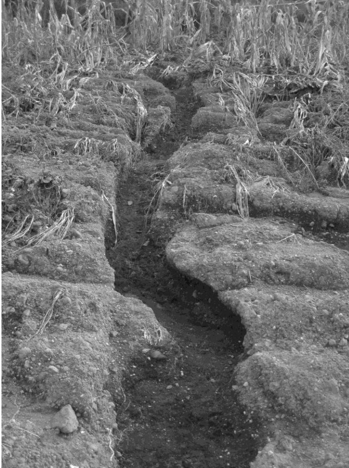
Figura 4. Ejemplo de cárcavas en parcelas de cultivo con maíz en noviembre de 2009.

está lo suficientemente endurecida para inhibir la formación de cárcavas. Todo lo contrario que en las huertas de maíz, donde la capa de suelo más superficial está totalmente desagregada al ir arrancando de manera aleatoria las plantas de maíz para el ganado caprino, vacuno y equino.