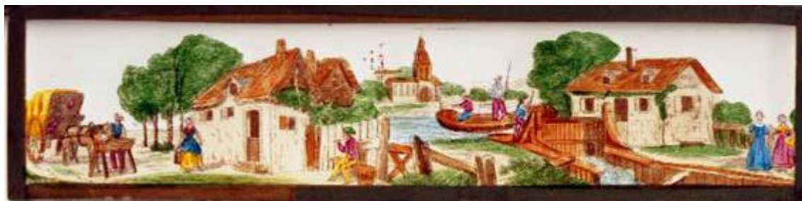
Imagen número 1

Al tener el lado horizontal mucho mayor que el vertical, las placas de linterna mágica con formato rectangular pueden albergar varias imágenes registradas a lo largo de un vidrio rectangular, que puede presentarse exento o engastado en un marco de madera. Las placas con formato rectangular tienen en común los valores de cinco indicadores (independiente, fijo, horizontal, deslizamiento y simple) y pueden ser agrupadas en cuatro subformatos según la variabilidad de los indicadores “tratamiento espacio-temporal” y “configuración material”: elíptico exento, elíptico engastado, íntegro exento (Imagen N° 1) e íntegro engastado.