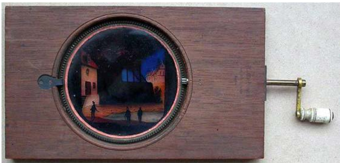
Imagen número 4

Las placas de linterna mágica con formato cíclico permiten el deslizamiento de imágenes en torno a la óptica del sistema de proyección mediante uno o varios discos de cristal montados en soportes de madera o metal. Las placas con formato cíclico suelen tener el eje de traslación localizado en el centro de la escena y suelen representar escenas que implican un movimiento rotatorio, como por ejemplo, las aspas de un molino de viento o de agua. Las placas de linterna mágica con formato cíclico, que tienen en común los valores de tres indicadores (independiente, móvil y engastado), pueden ser agrupadas en siete subformatos según la variabilidad del resto de los indicadores (“eje de traslación”, “procedimiento de traslación”, “tratamiento espacio-temporal” y “configuración morfológica”): central de obturación simple, central de obturación compuesta, central de polea simple, central de polea compuesta, central de cremallera simple (Imagen N° 4), central de cremallera compuesta y excéntrico.