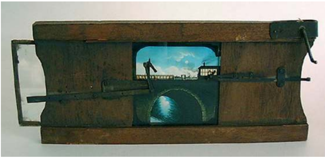
Imagen número 9