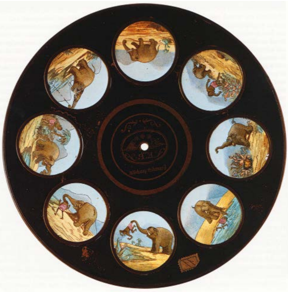
Imagen número 2