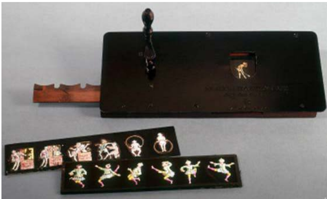
Imagen número 3