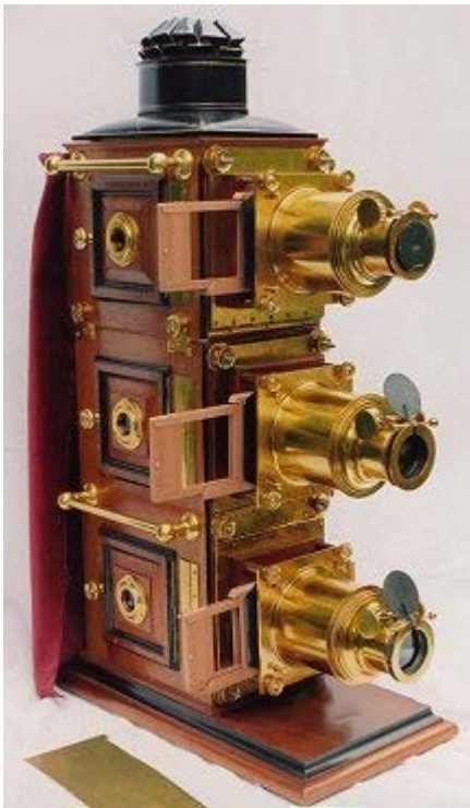
Imagen número 6