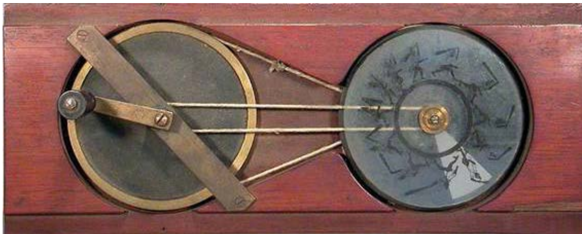
Imagen número 8

Las placas de linterna mágica con formato cinematográfico son discos que tienen un motivo aislado y que son susceptibles de ser animados de forma cíclica. Para conseguir tal animación, el disco debe ser insertado en un soporte al que se sujeta por muelles de alambre o mediante un manguito metálico con rosca, lo que facilita que pueda ser retirado y sustituido por otro. Las placas con formato cinematográfico comparten los valores de seis indicadores de formato (dependiente, fijo, central, íntegro, exento y simple) y pueden ser agrupadas en dos subformatos, según la variabilidad del indicador “procedimiento de traslación”: de cremallera y mixto (Imagen N° 8).