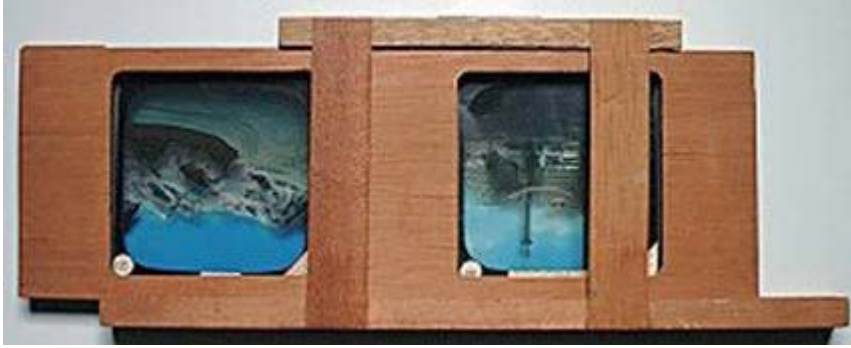
Imagen número 5

Así, a partir de un simple cambio sin transición visual, o de un fundido encadenado, es posible alternar dos o más motivos diferentes de una secuencia, que pueden expresar desde la relación entre tipos humanos o animales, hasta el paso del tiempo, en los cuadros disolventes. De uso generalizado a partir de 1830, las placas de linterna mágica con formato estándar tienen en común los valores de cinco indicadores (dependiente, fijo, longitudinal, mixto y sencillo) pueden ser agrupadas en cuatro subformatos según la variabilidad del “tratamiento espacio-temporal” y la “configuración material”: elíptico exento (Imagen N° 7), elíptico engastado, íntegro exento y íntegro engastado.