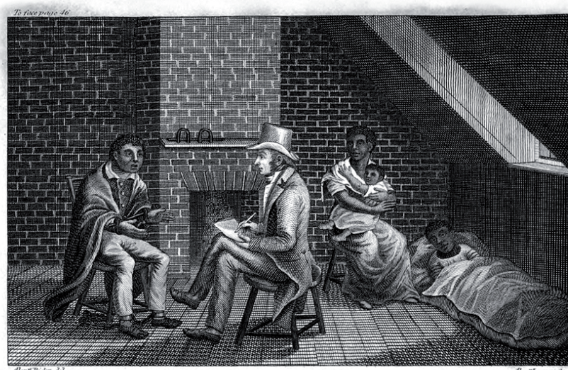
The Author noting down the narratives of several freeborn people of colour who had been kidnapped.