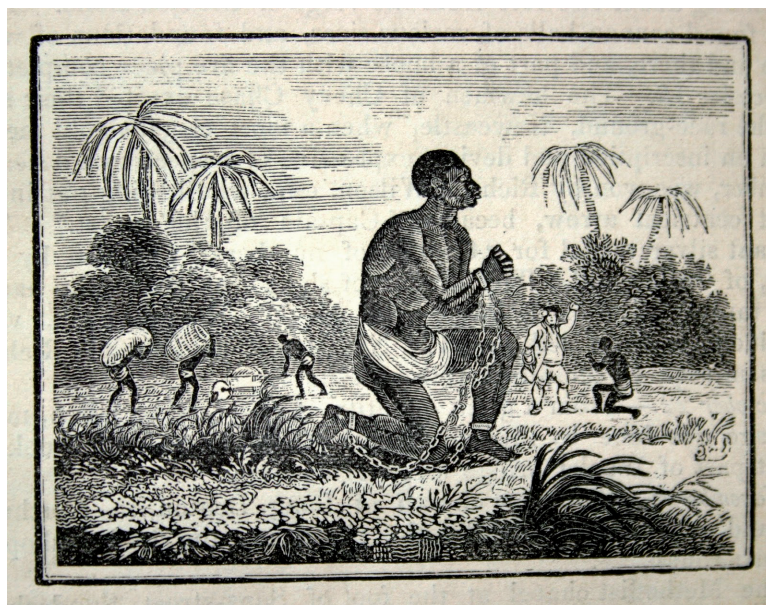
Grabado de esclavo africano en las colonias británicas de ingenios de azúcar. Obra del artista Thomas Bewick. Esta imagen sirvió para la impresión de la obra teatral La princesa de Zanfara (1789).

Guinea Voyage , una serie de cartas publicadas y dirigidas a Thomas Clarkson. El abogado, anticuario y topógrafo francmasón William Hutchinson publica una serie de obras teatrales que prosiguen el mismo objetivo social de concienciar mediante el arte la abominación de la esclavitud británica. Así en su obra La princesa de Zanfara (1789), inicialmente rechazada por Mr. Harris, el responsable del teatro del Covent Garden de Londres, fue ampliamente representada por gran parte de los teatros británicos. Las primeras impresiones de 1789 llevan la representación de un esclavo negro encadenado y arrodillado, obra del grabador y ornitólogo Thomas Bewick (1753-1828) 7 .