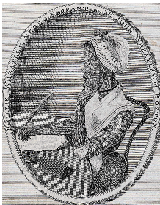
Frontispicio de su poemario Poems on Various Subjects (1773), editado en Londres. Grabado adscrito a Scipio Moorhead, a quien la poeta dedica uno de sus escritos en la edición.