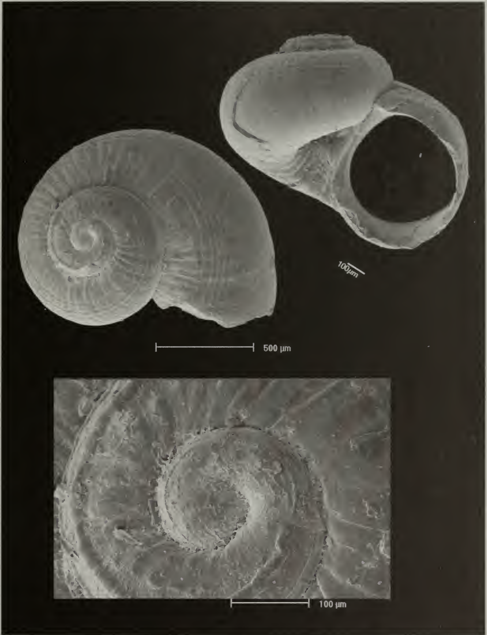
Lámina 1.- Emiliotia immaculatus , especie nueva.