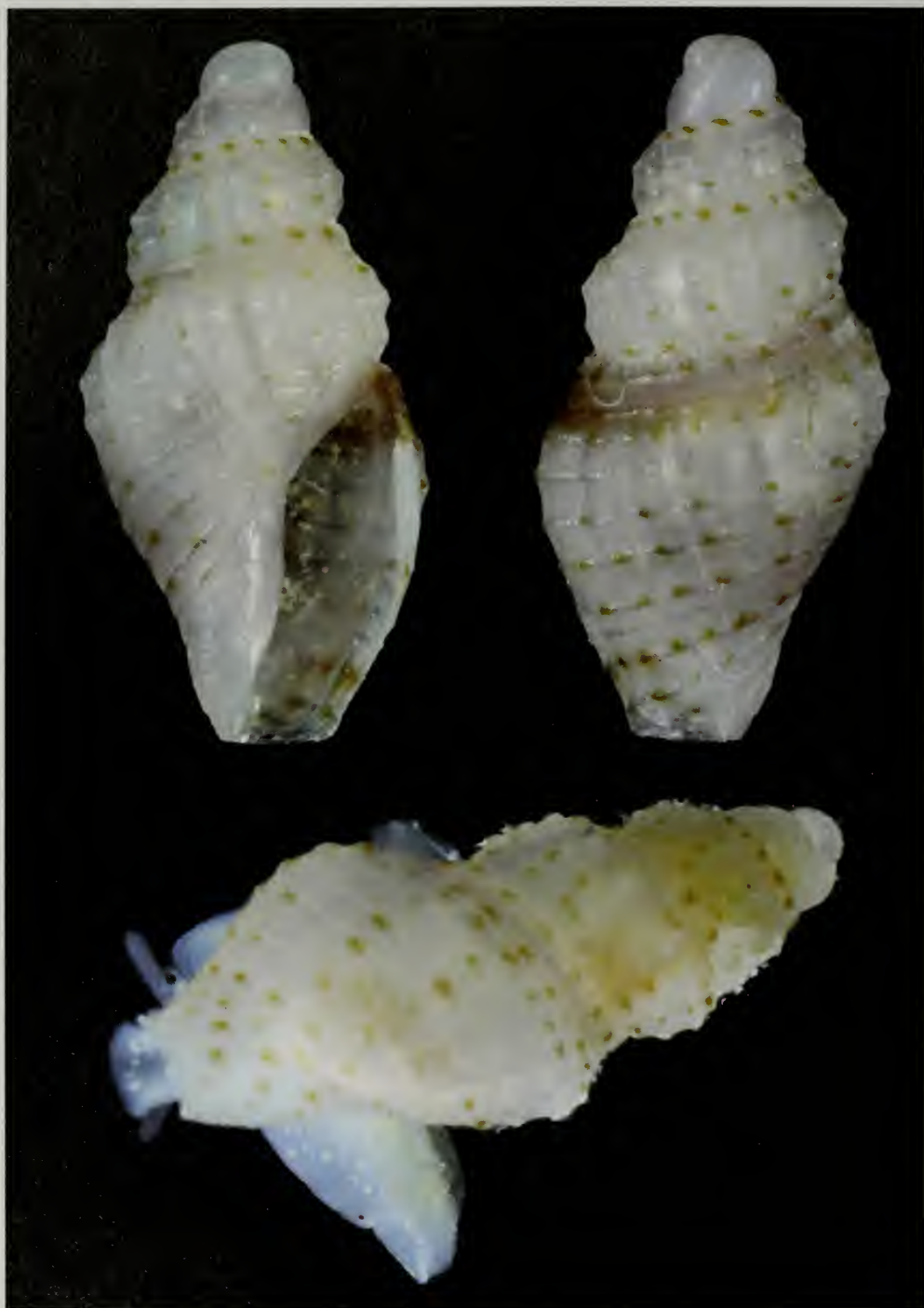
Lámina 2.- Steironepion delicatus , especie nueva.