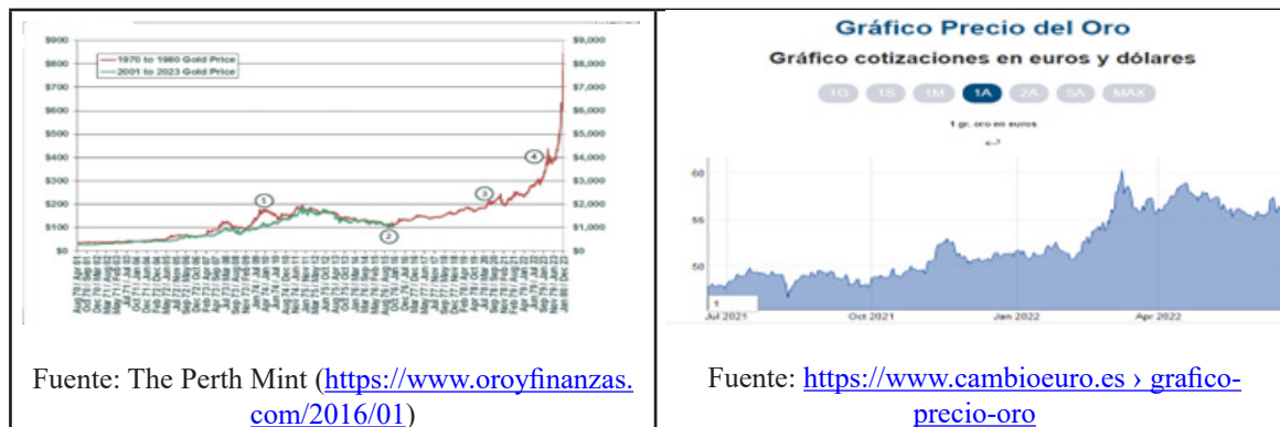
Gráfico 2 (a-b) Comparativa de la producción mundial y precio del oro (1960-1970 y 2001-2022)

En relación a lo expuesto, reputados especialistas económicos y empresas de inversión sostienen que el precio del oro en dólares se ha revalorizado un 38% en los últimos doce meses y está en máximos de los últimos 8 años alrededor de los 1.750 dólares, situándose el mismo en términos nominales de 1.921 dólares, alcanzados en fechas recientes. Añadamos que su precio se está preparando para alcanzar nuevos máximos históricos de su cotización, superior a los 2.000 dólares por onza troy.