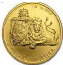
Onza de oro (República Checa/Niue)