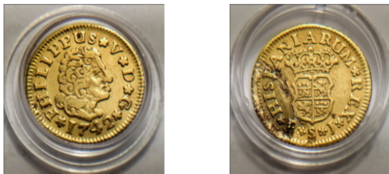
Figura 1. Medio escudo de oro Felipe V (1742), Sevilla

Originariamente, en Castilla se crea, en torno a 1497, el excelente de Granada (moneda de oro que se movía en la misma línea comprendida por el ducado veneciano), el excelente de Valencia (1481) y el principat de Cataluña (1493), y que junto al resto se relacionaban con una moneda de cálculo, el maravedí (el excelente de Granada o ducado equivalía a 375 maravedíes). Así, Aragón (1506), Valencia (1508) y Navarra (1508) se adhirieron a este sistema monetario y completaron la uniformidad del circulante en los territorios de la monarquía hispana. Hacia 1537 el ducado toma el nombre de escudo y fue Carlos I el que accedió a que este se asimile a 350 maravedíes, prosiguiendo con Felipe II, quien lo ajustó a 400 maravedíes, en vez de reducir la ley como que se solicitaba desde varios frentes 6 .