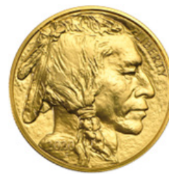
Figura 3. Onza de oro (Rep. Checa/Niue).

Figura 4. Onza de oro (República del Chad).