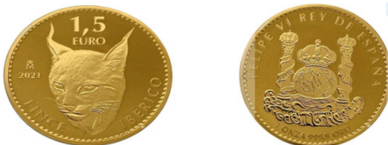
Figura 2. Onza del lince ibérico (España)

1 ONZA 999.9 ORO, rodeadas por una gráfila de piñones. El reverso reproduce una imagen de la cabeza de un lince ibérico, ubicándose a su izquierda la marca de Ceca y el año de acuñación. En la parte superior se ubica el valor facial y en la inferior y en sentido circular la leyenda LINCE IBÉRICO, con gráfila de piñones alrededor (Fig. 2). El Boletín Oficial del estado (11 de julio de 2022) recoge una nueva versión (un toro por el lince) con 15.000 ejemplares de tirada inicial.